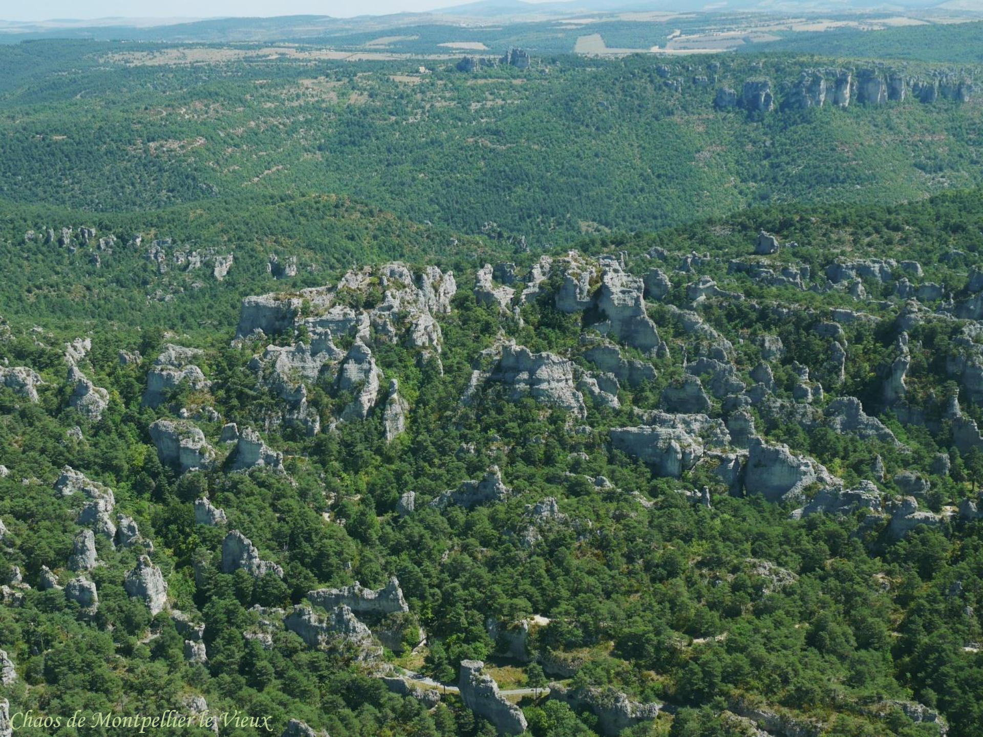
Chaos de Montpellier le Vieux