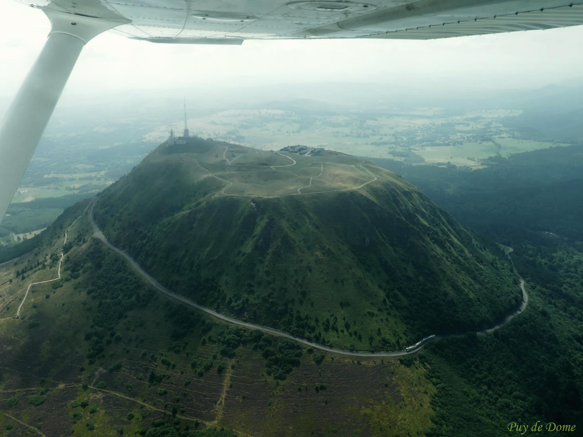
Puy de Dome