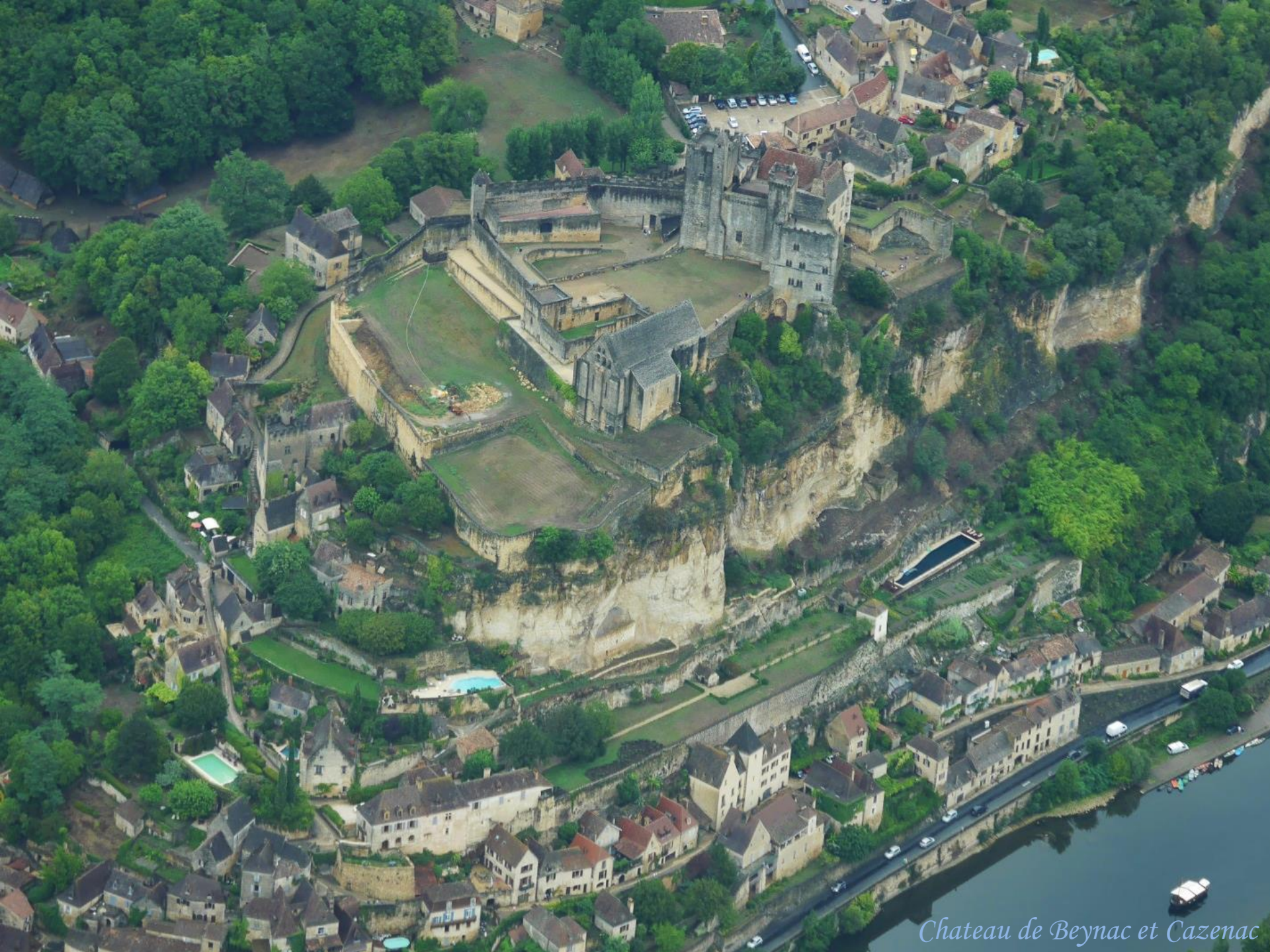
Chateau de Beynac et Cazenac