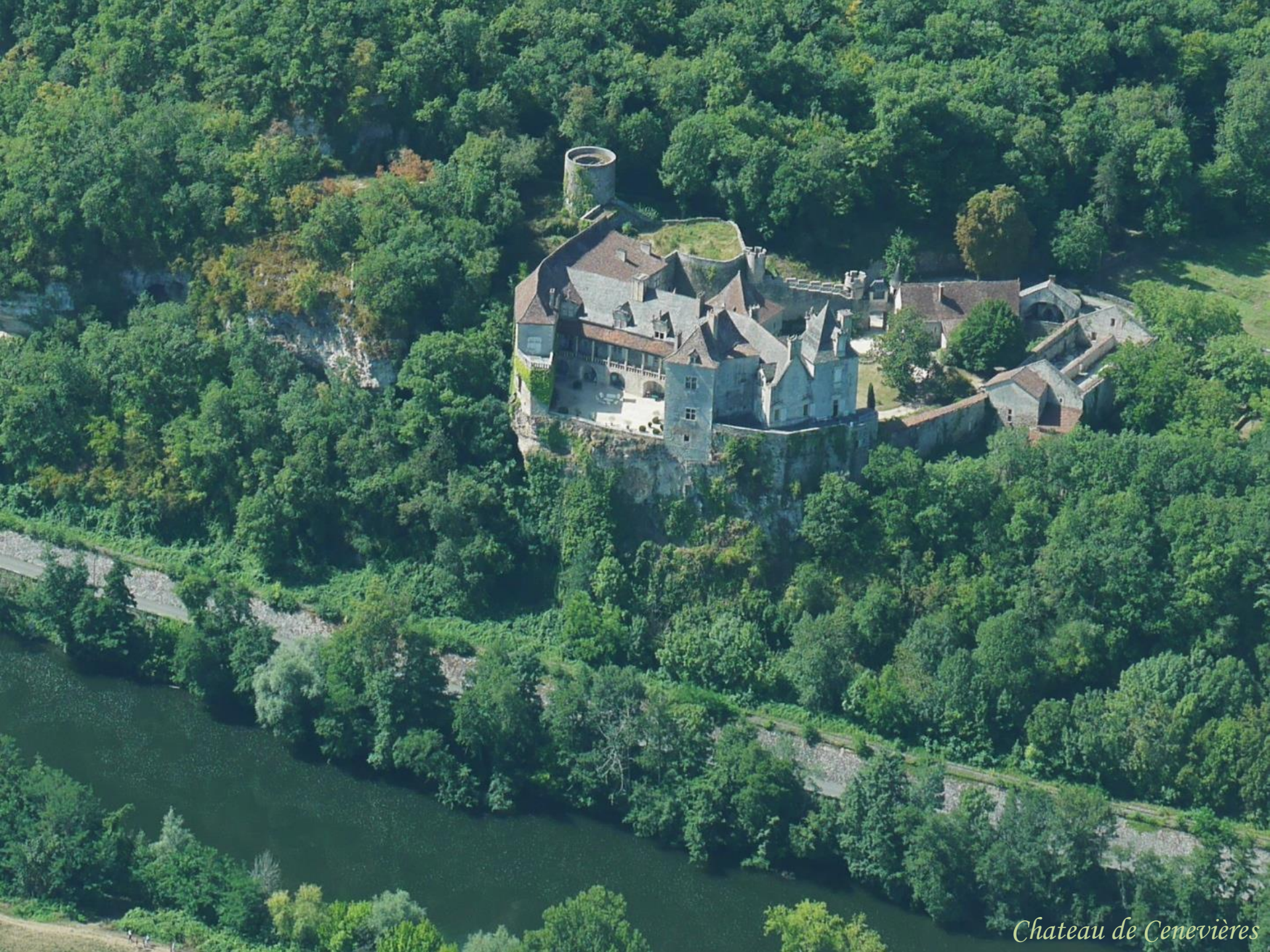
Chateau de Cenevières