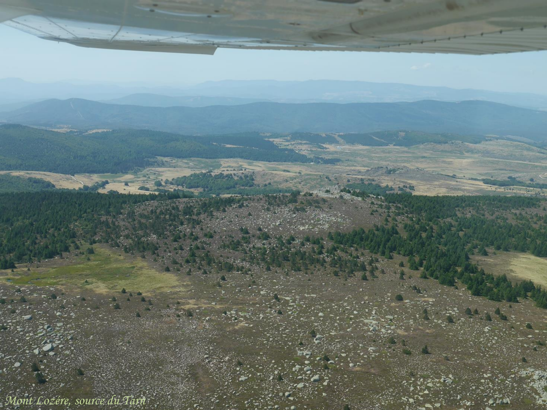
Mont Lozère, source du Tarn