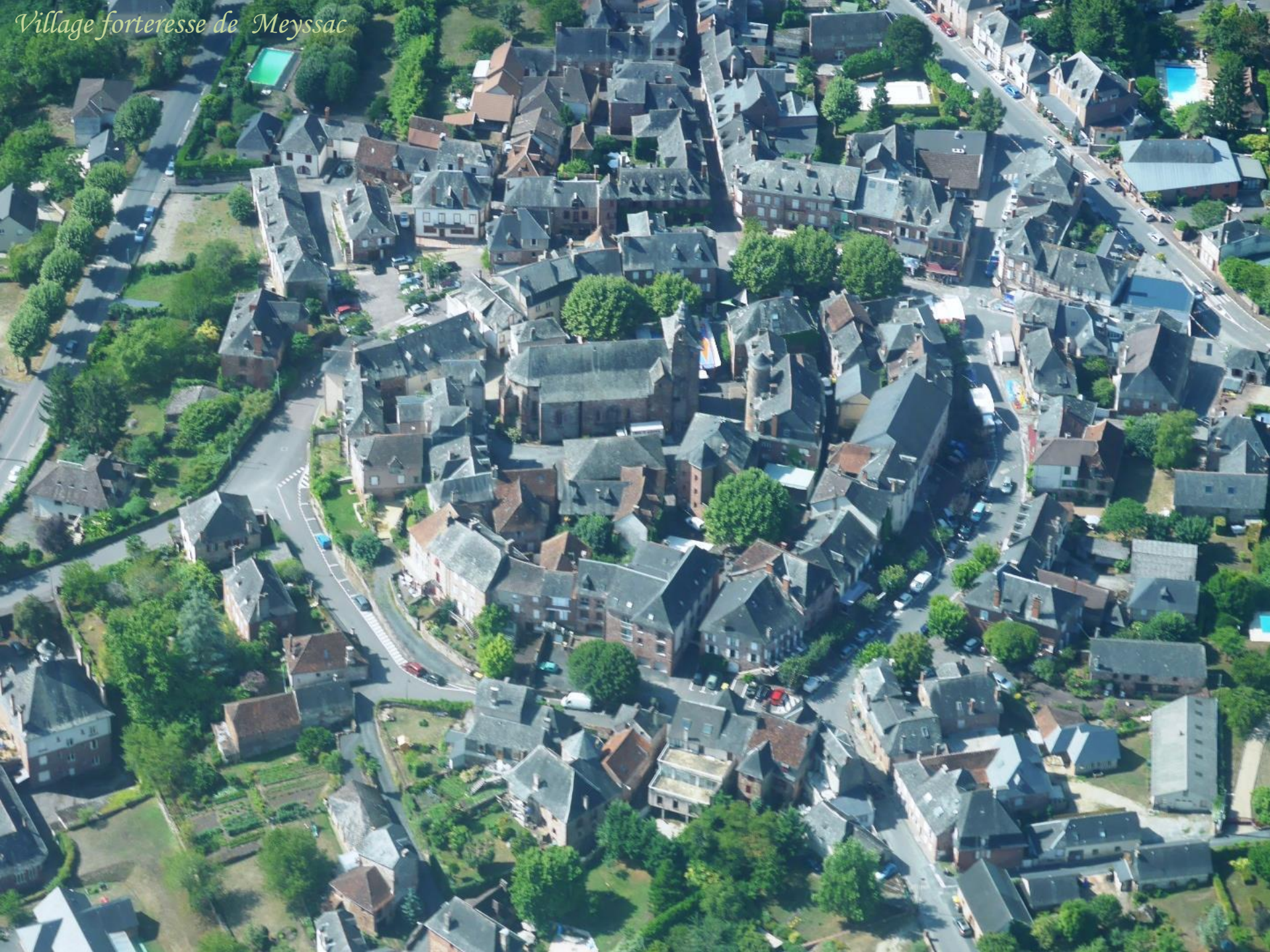
Village forteresse de Meyssac