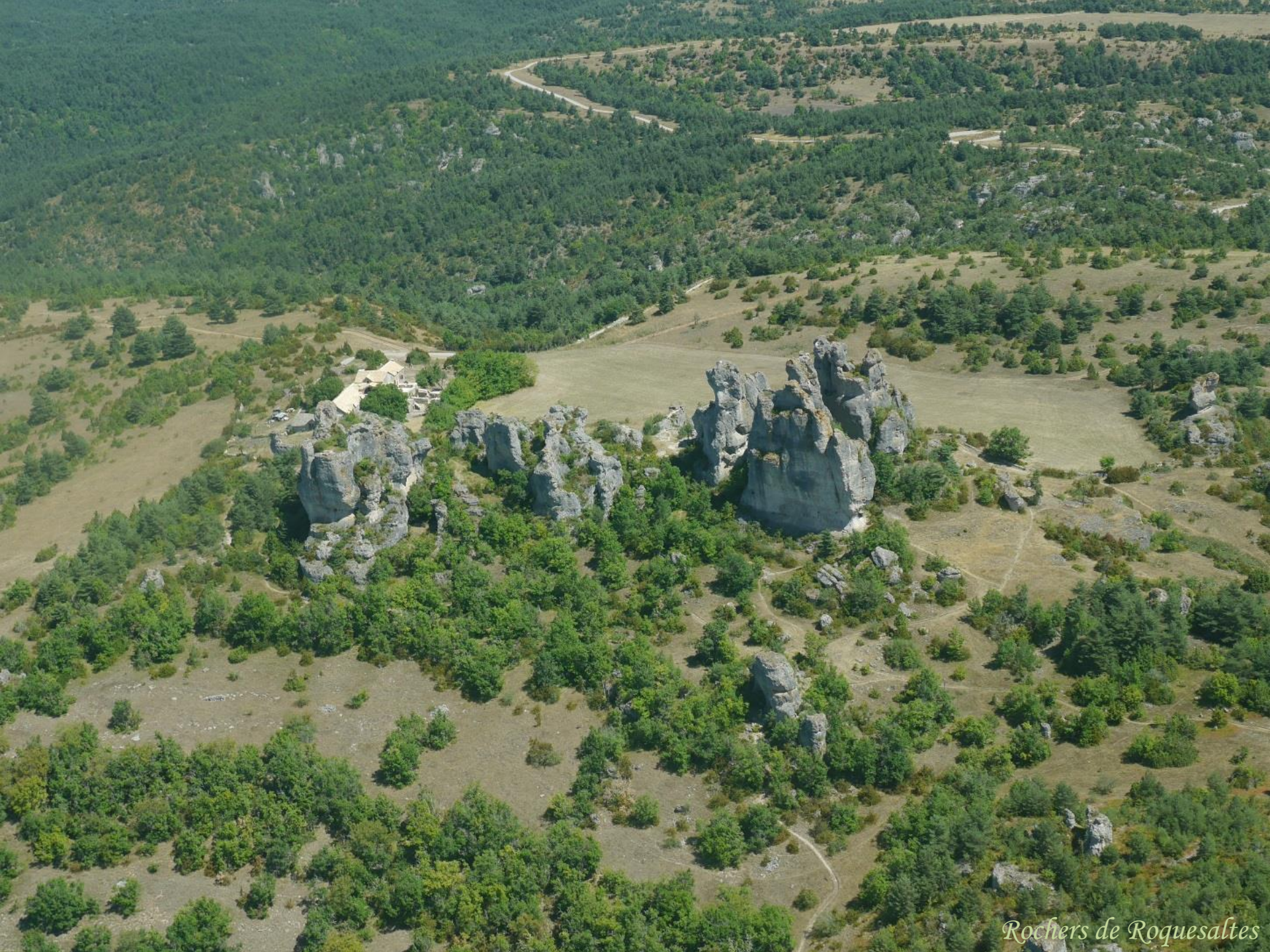
Rochers de Roquesaltes