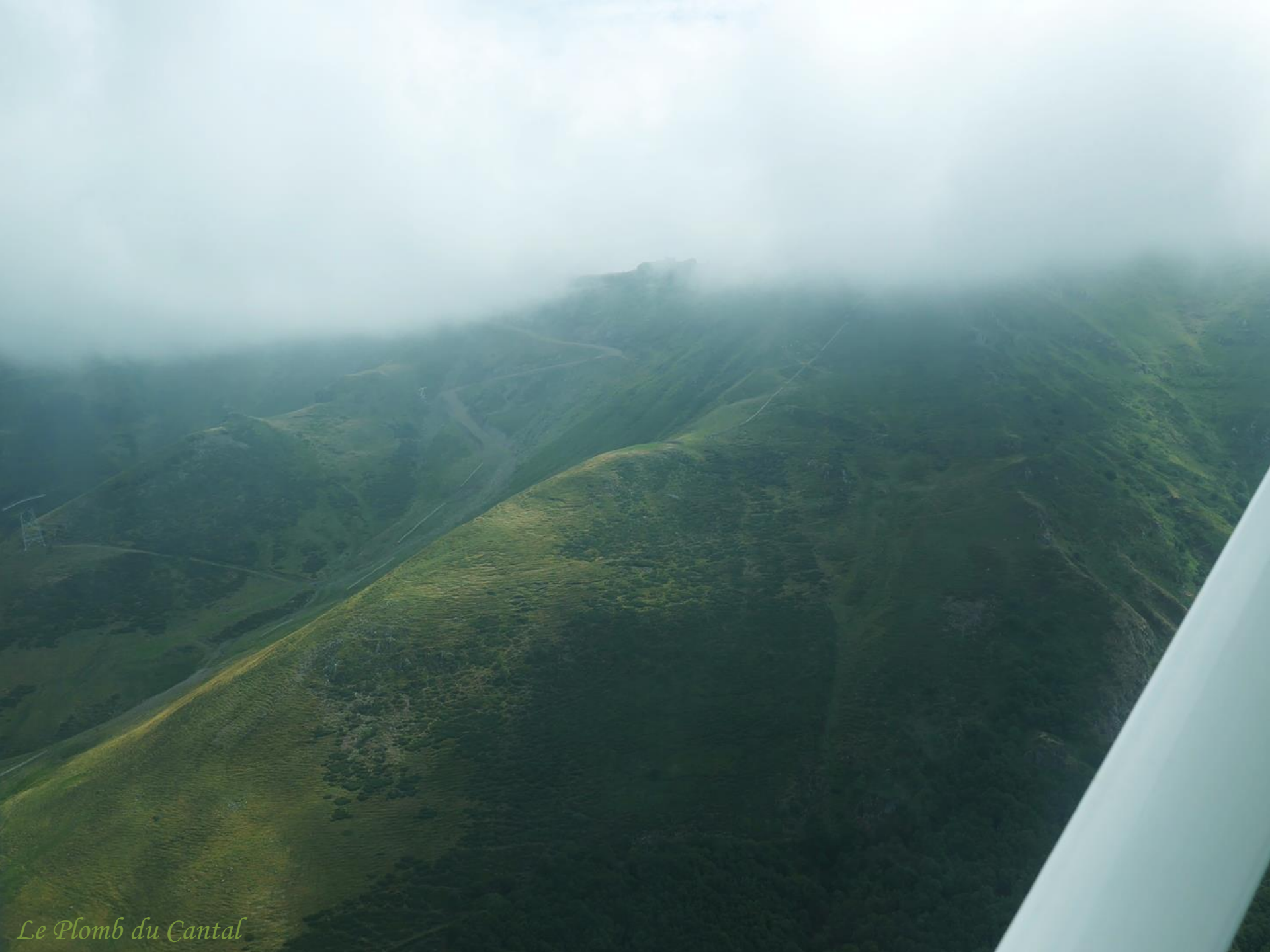
Le Plomb du Cantal