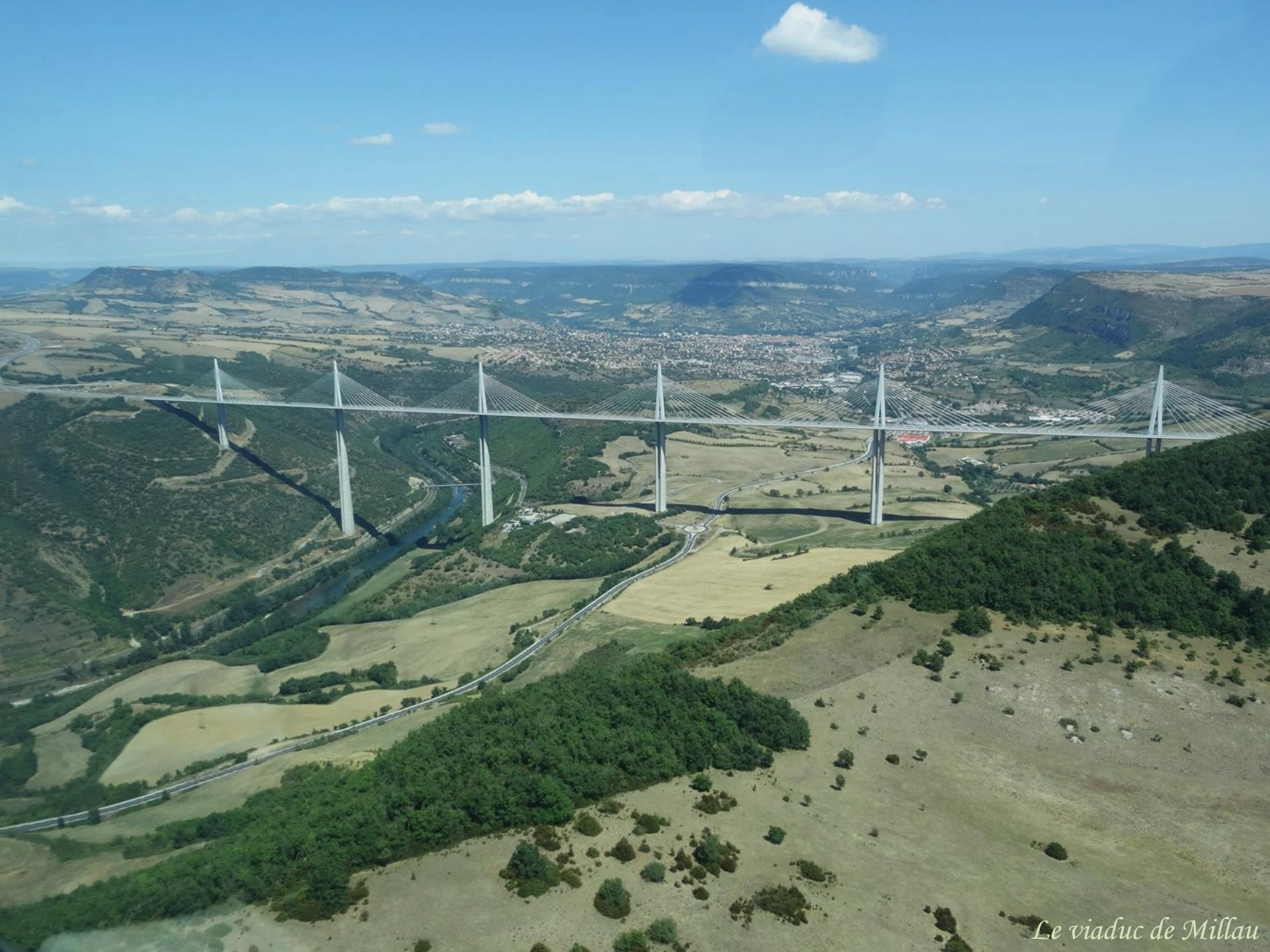
Le viaduc de Millau