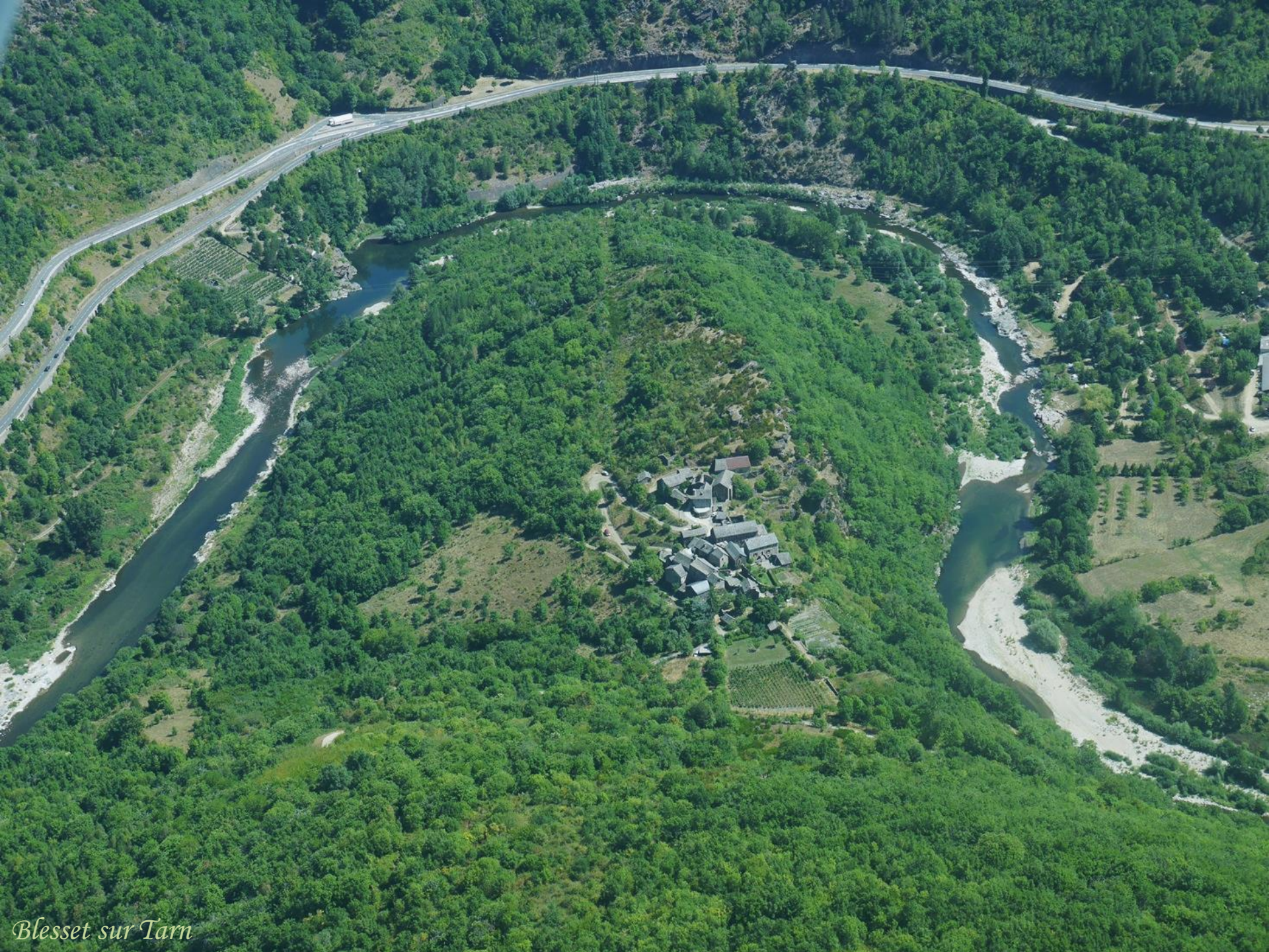
Blesset sur Tarn