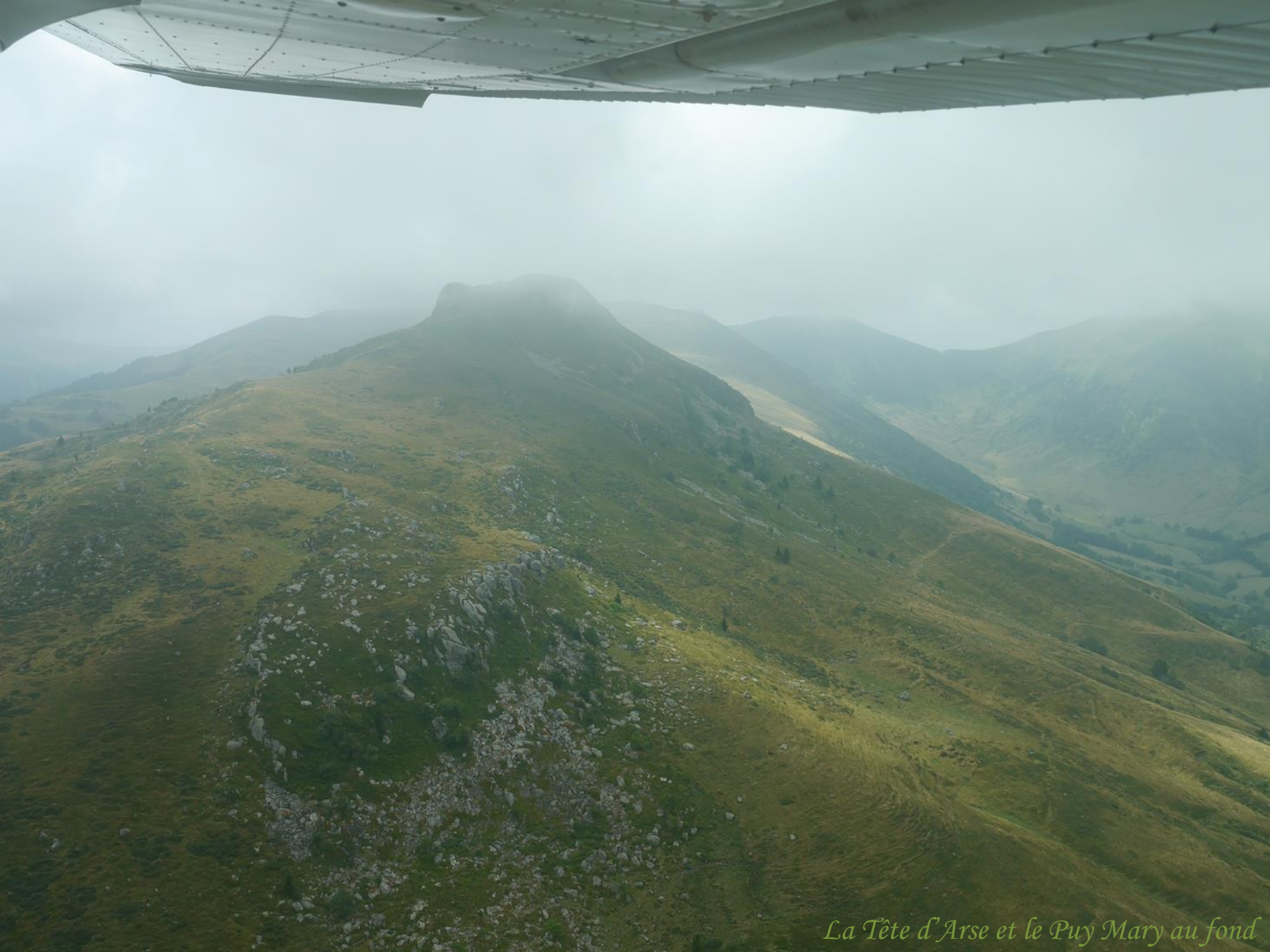
La Tête d'Arse et le Puy Mary au fond