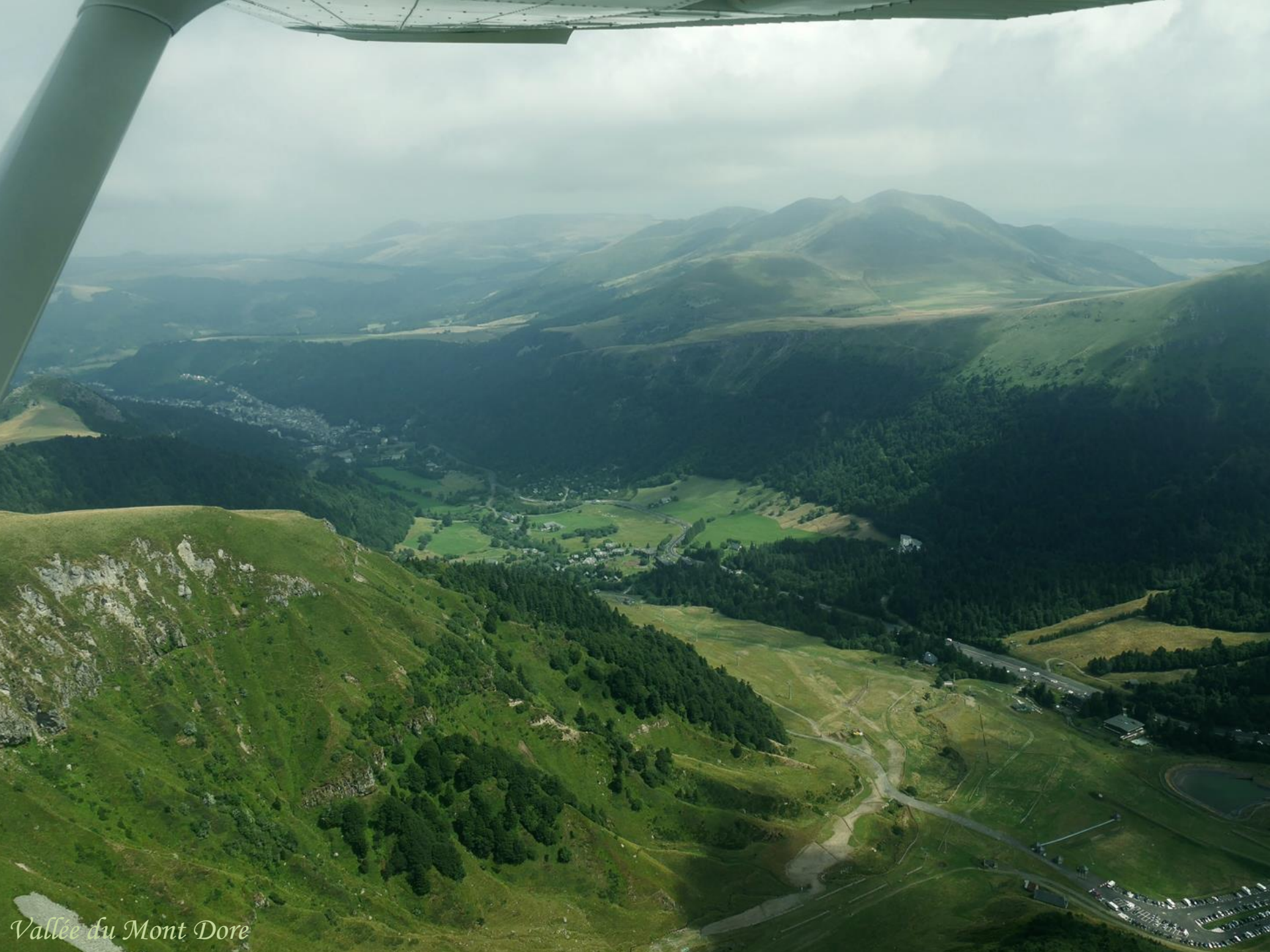
Vallée du Mont Dore