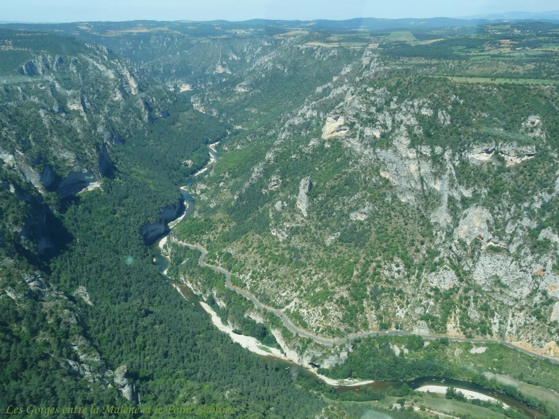
Les Gorges entre la Malène et le Point Sublime