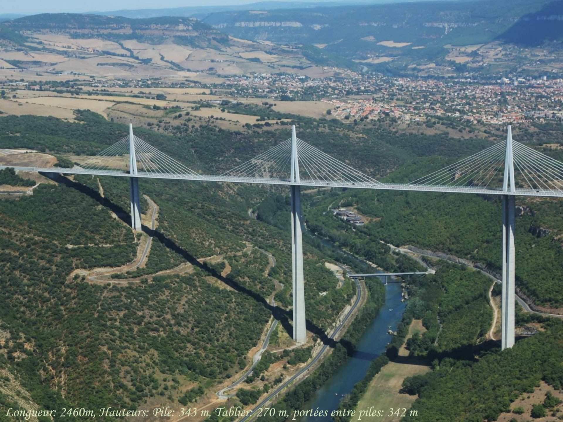
Longueur: 2460m, Hauteurs: Pile: 343 m, Tablier: 270 m, portées entre piles: 342 m