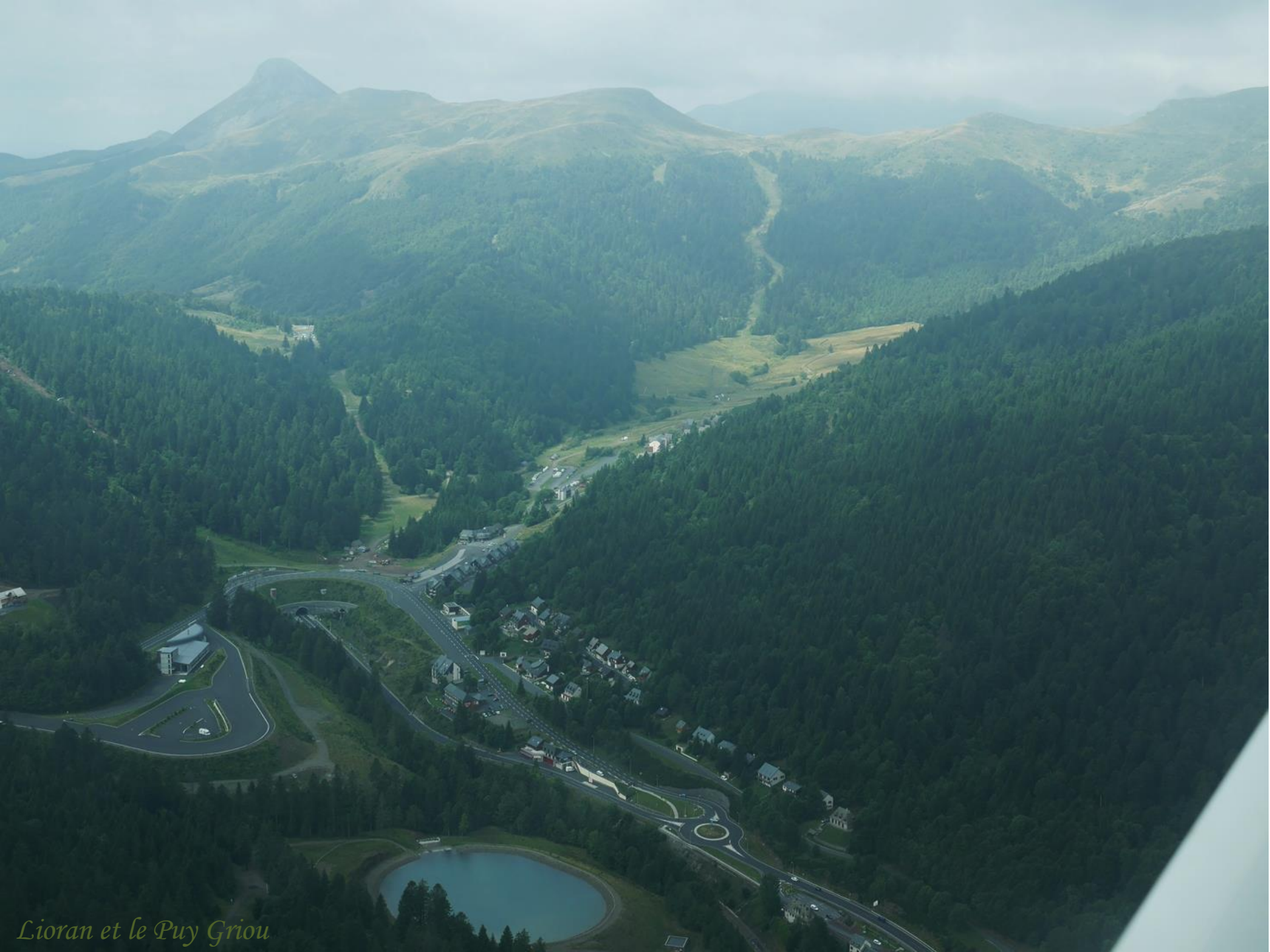
Lioran et le Puy Griou