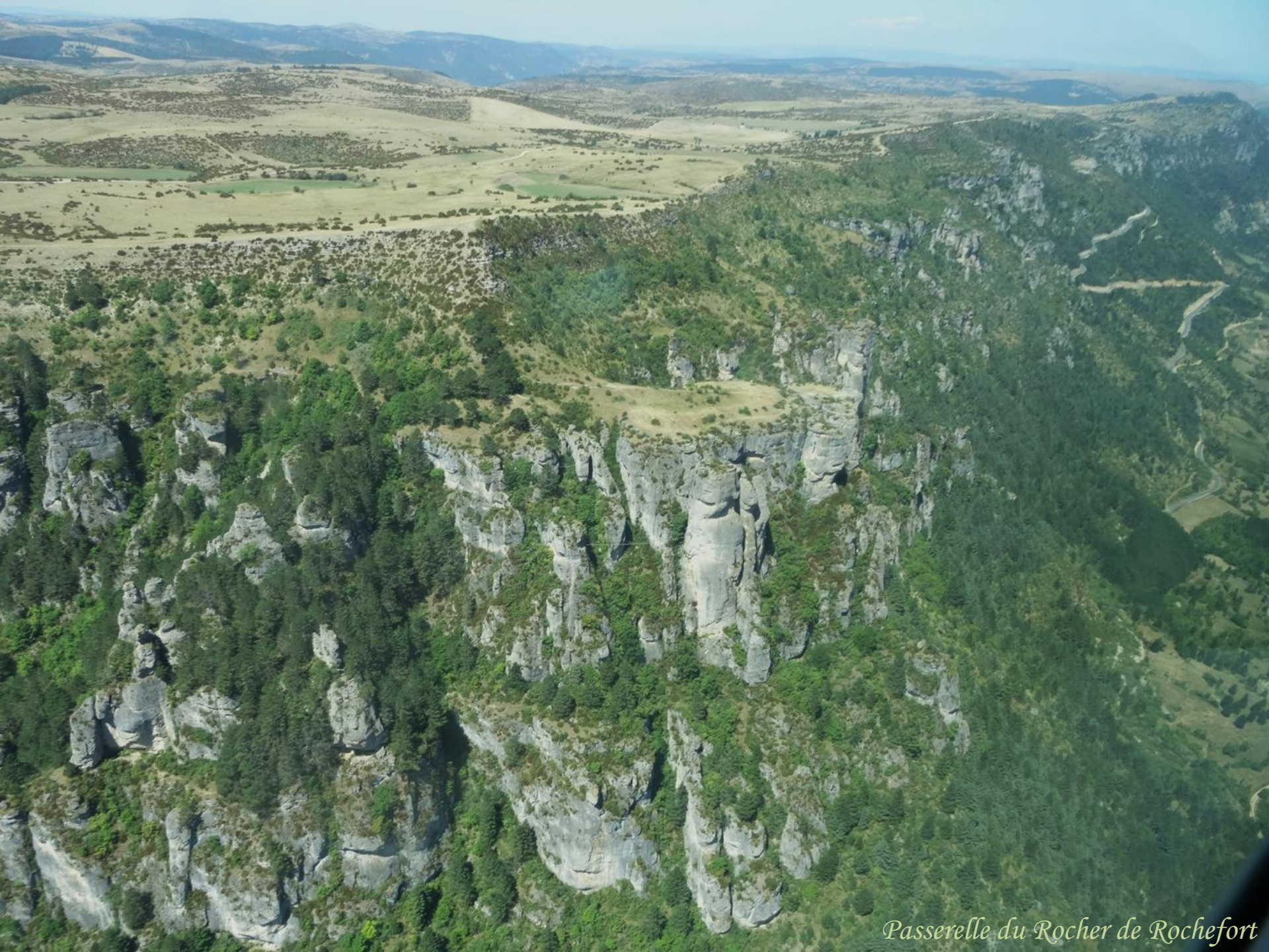
Passerelle du Rocher de Rochefort