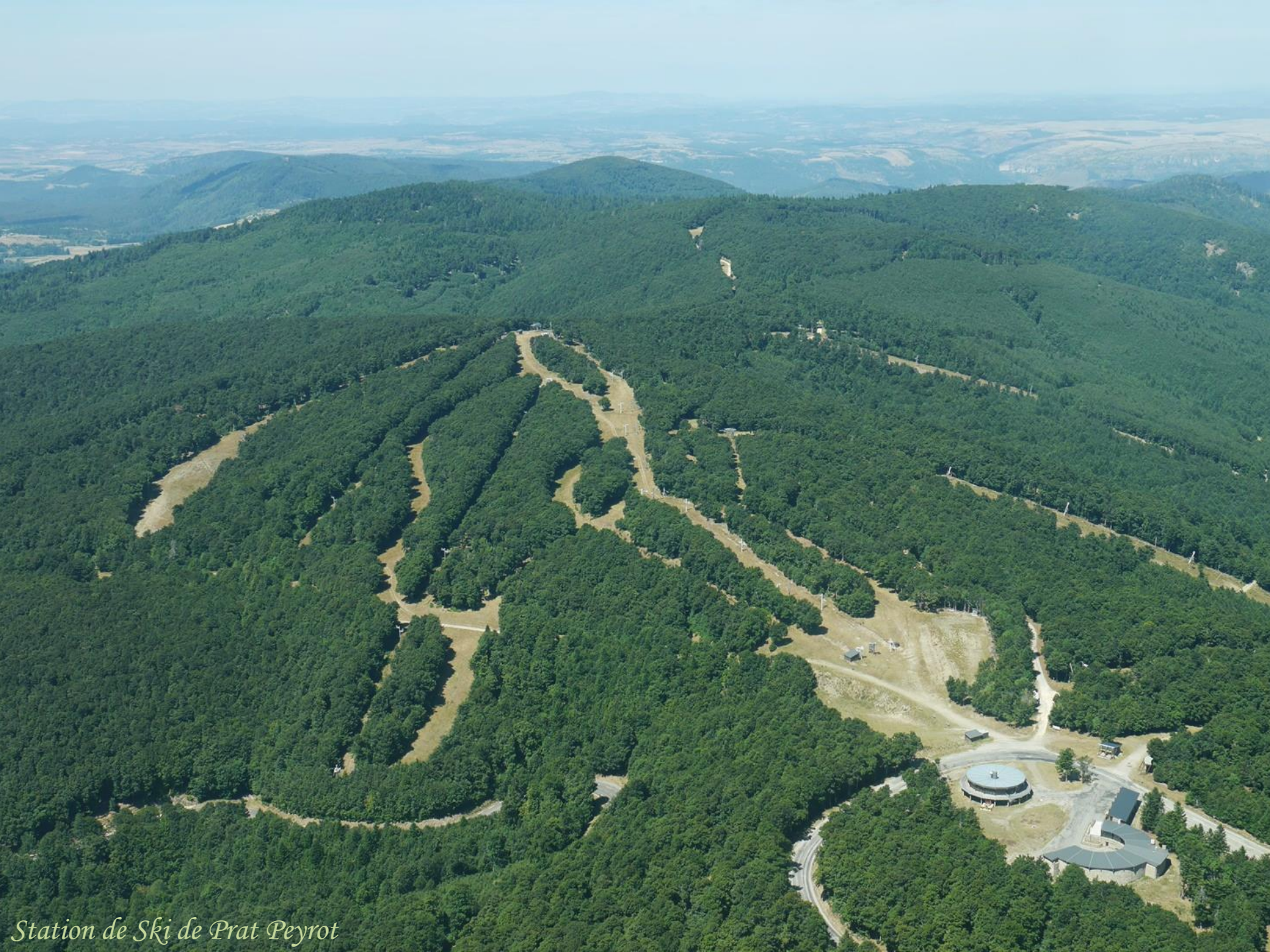
Station de Ski de Prat Peyrot