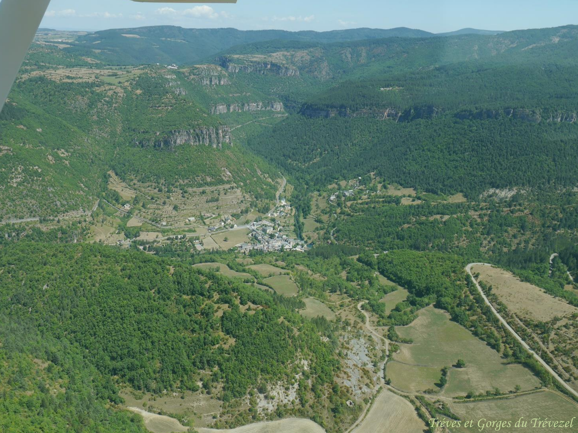
Trèves et Gorges du Trévezel