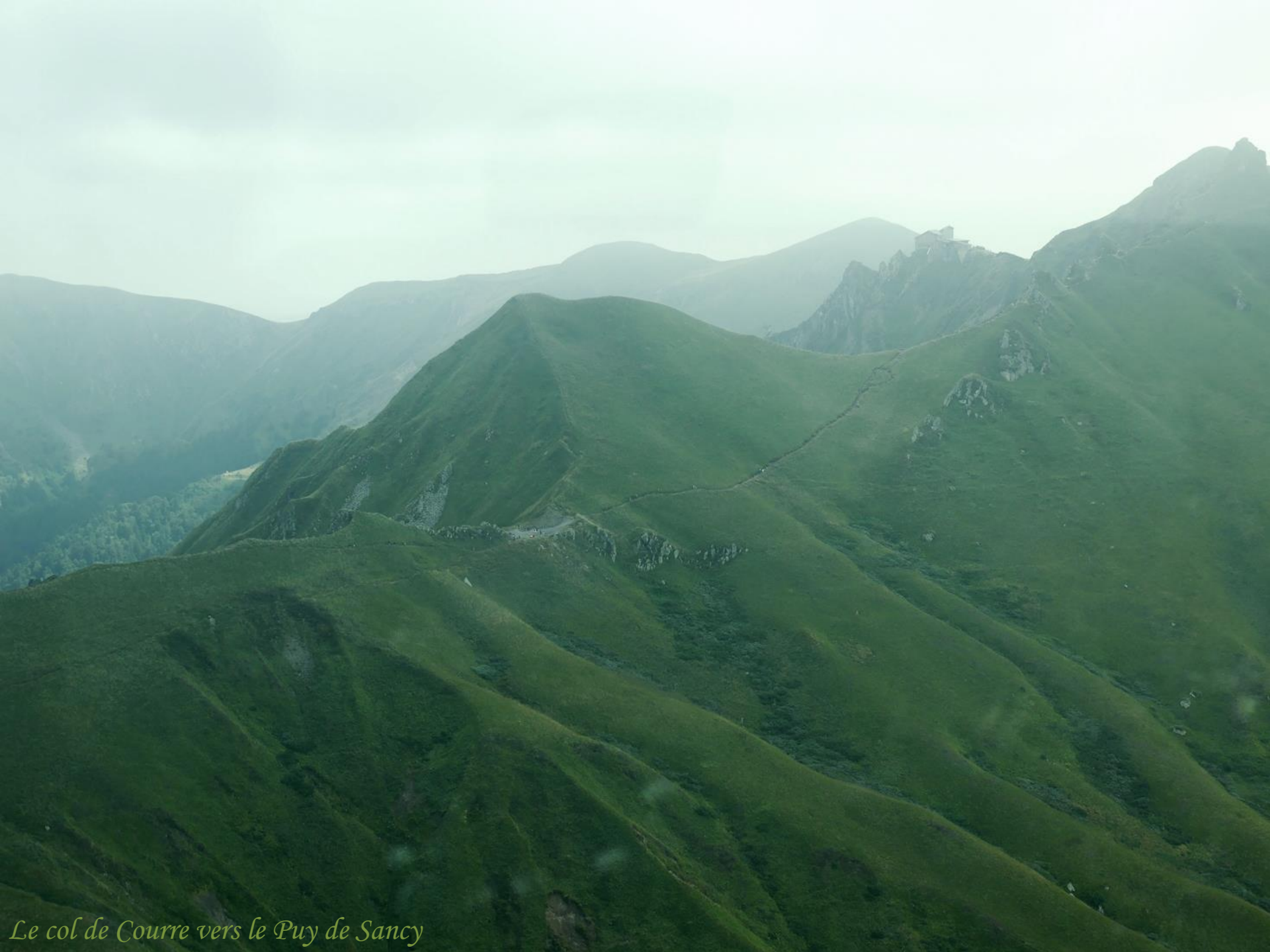
Le col de Courre vers le Puy de Sancy