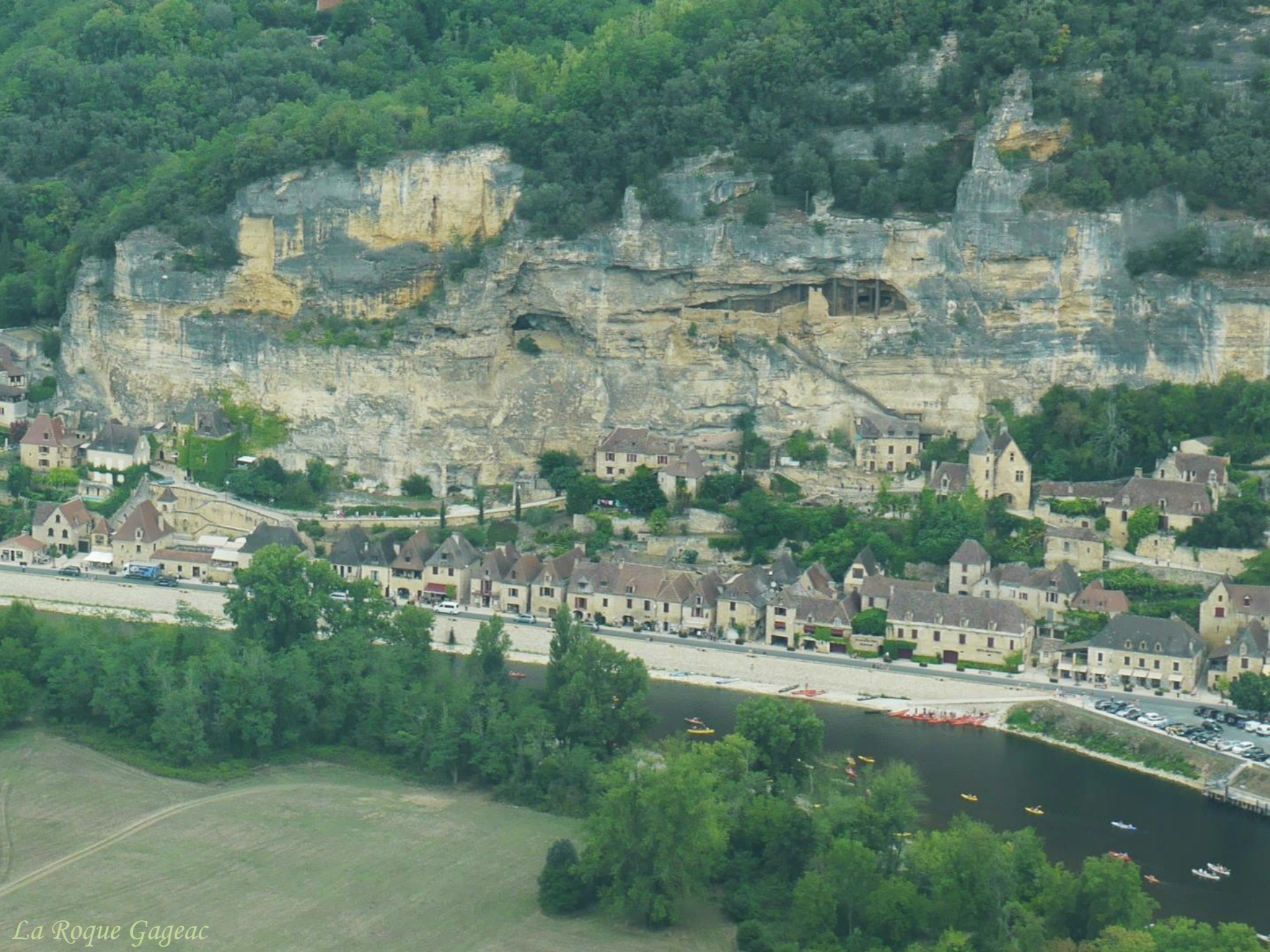
La Roque Gageac