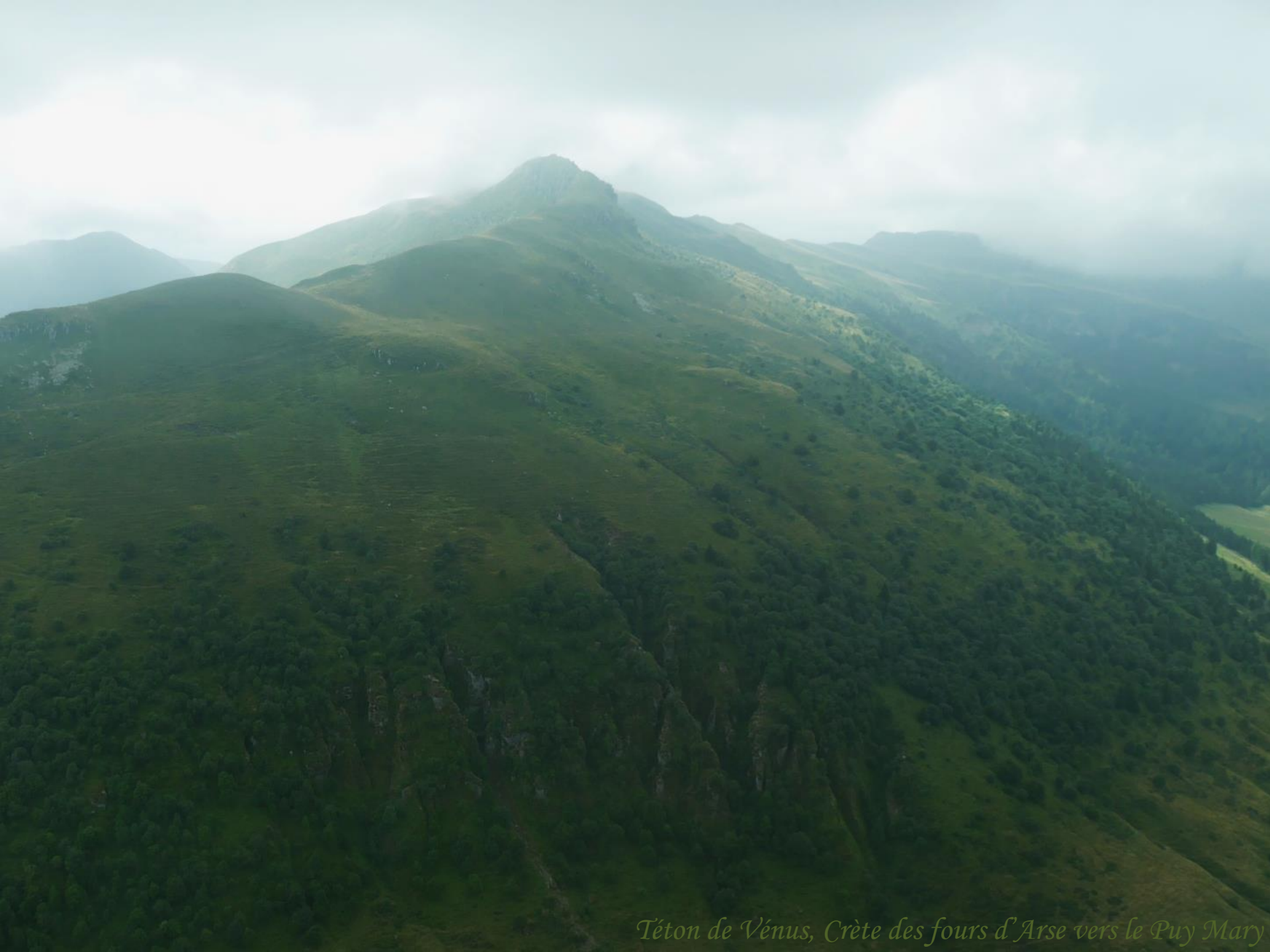
Téton de Vénus, Crête des fours d'Arse vers le Puy Mary