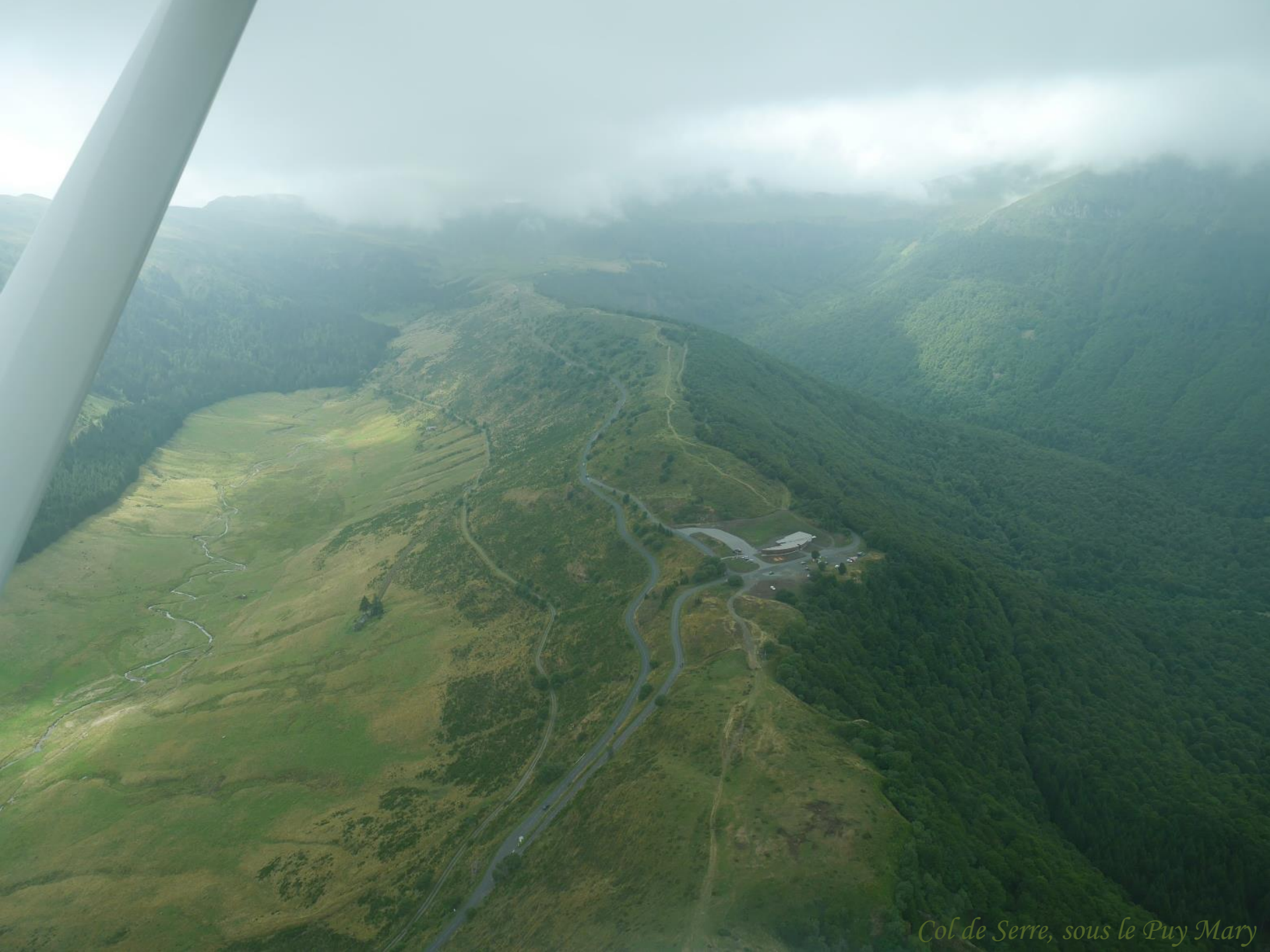
Col de Serre, sous le Puy Mary