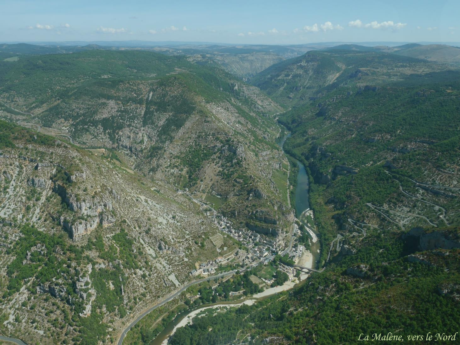
La Malène, vers le Nord