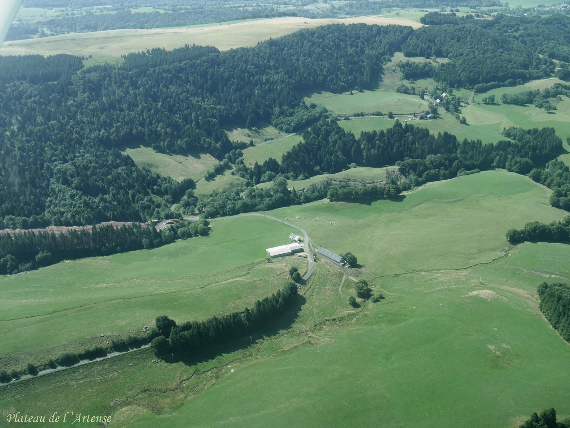
Plateau de l'Artense