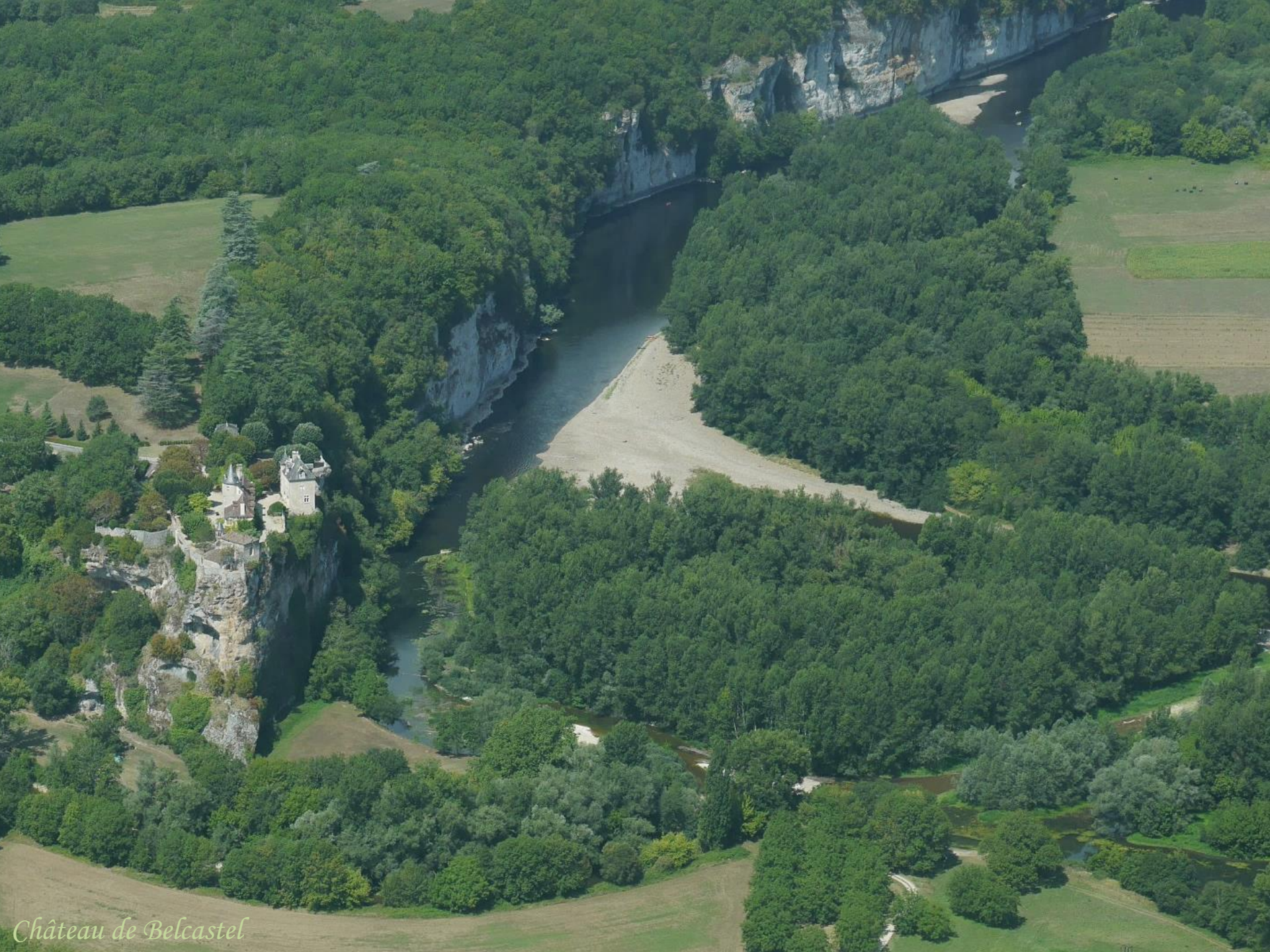
Château de Belcastel