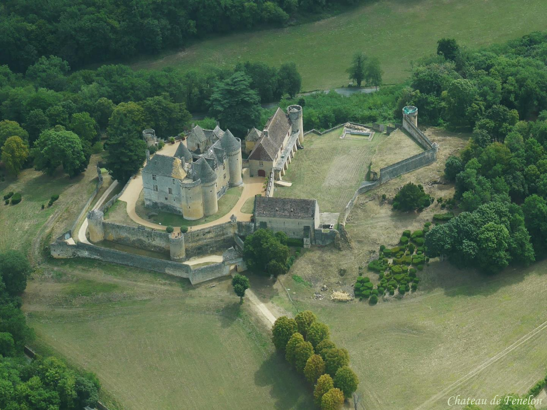
Chateau de Fenelon