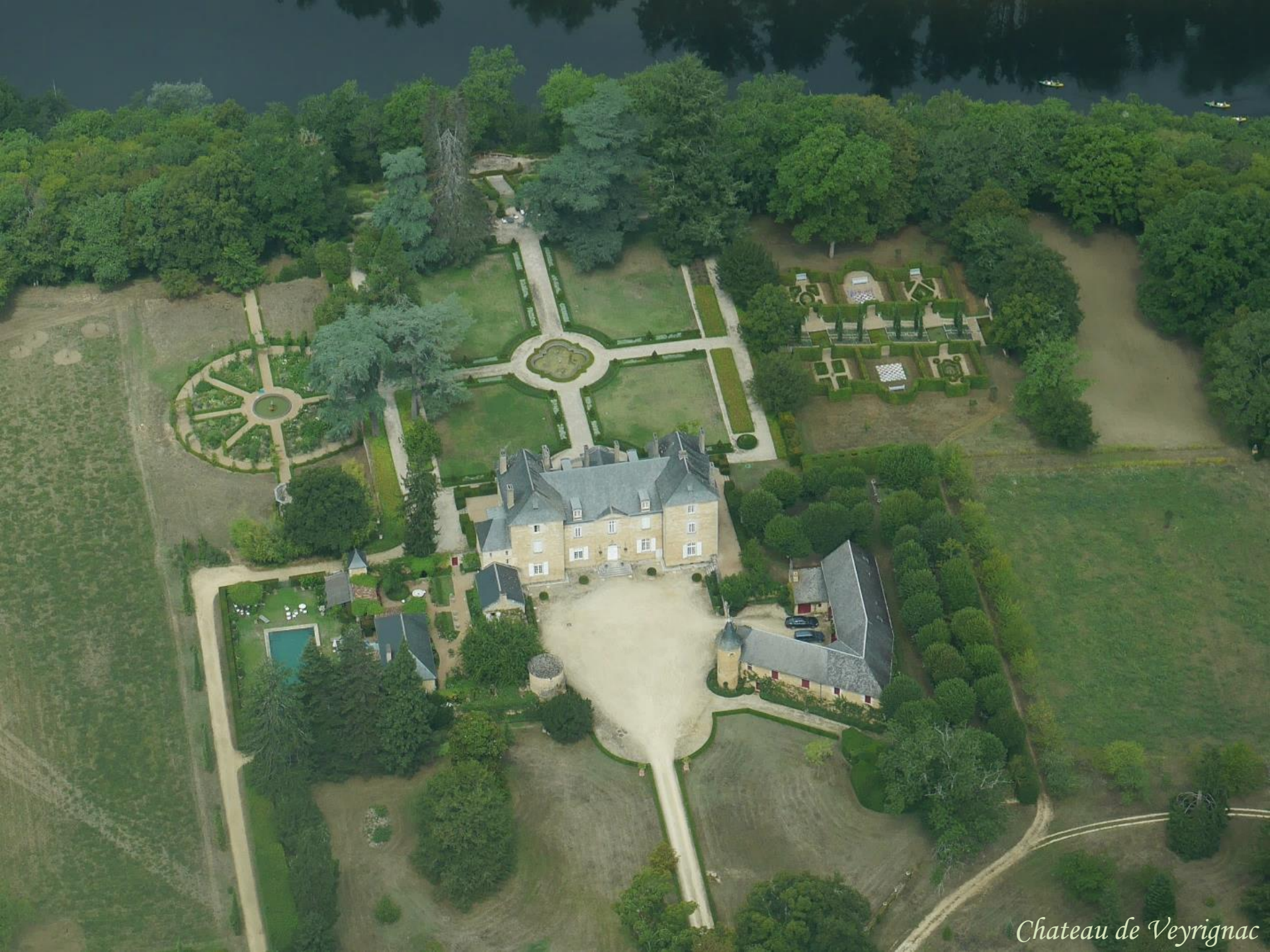
Chateau de Veyrignac