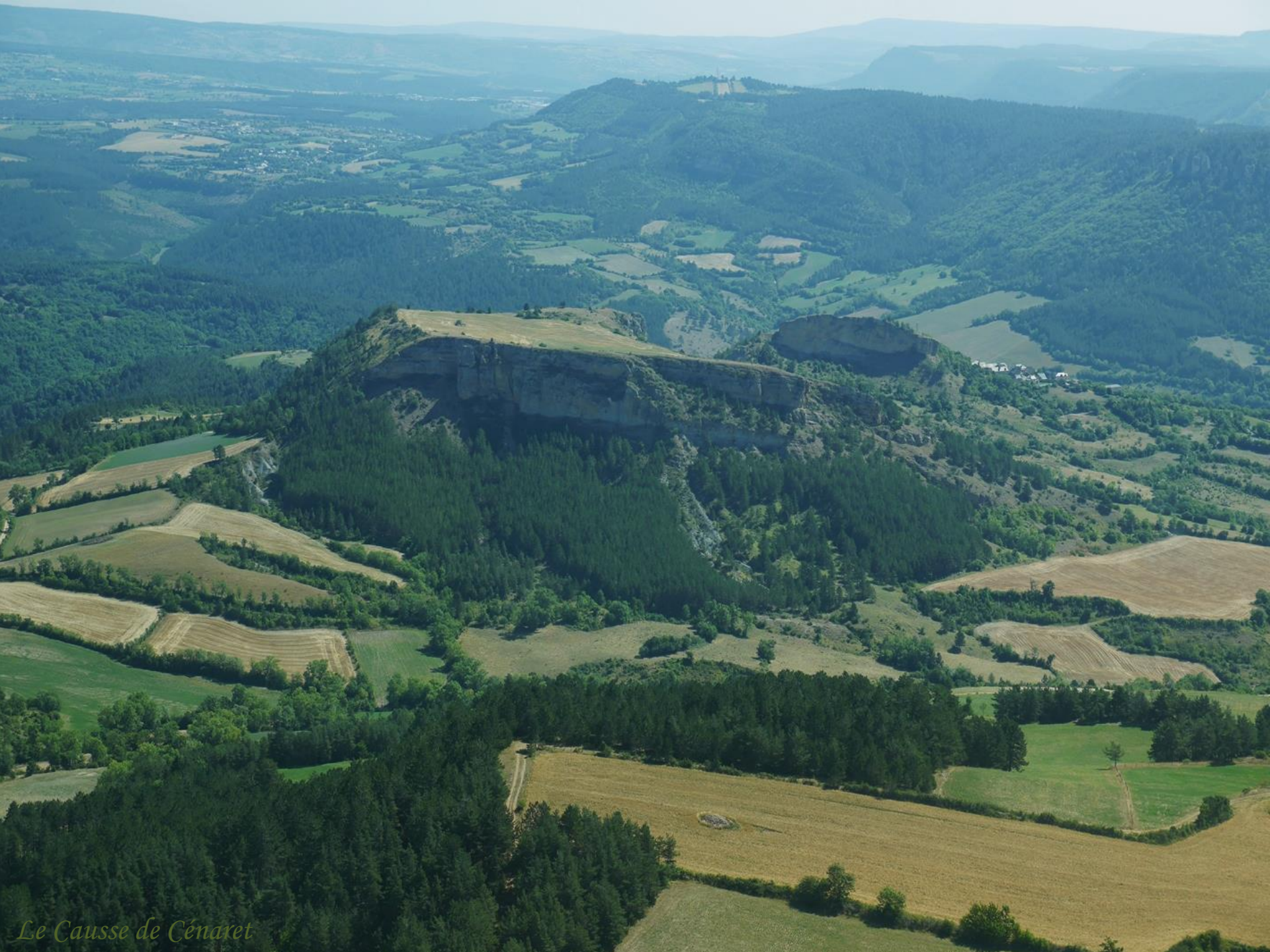
Le Causse de Cénaret