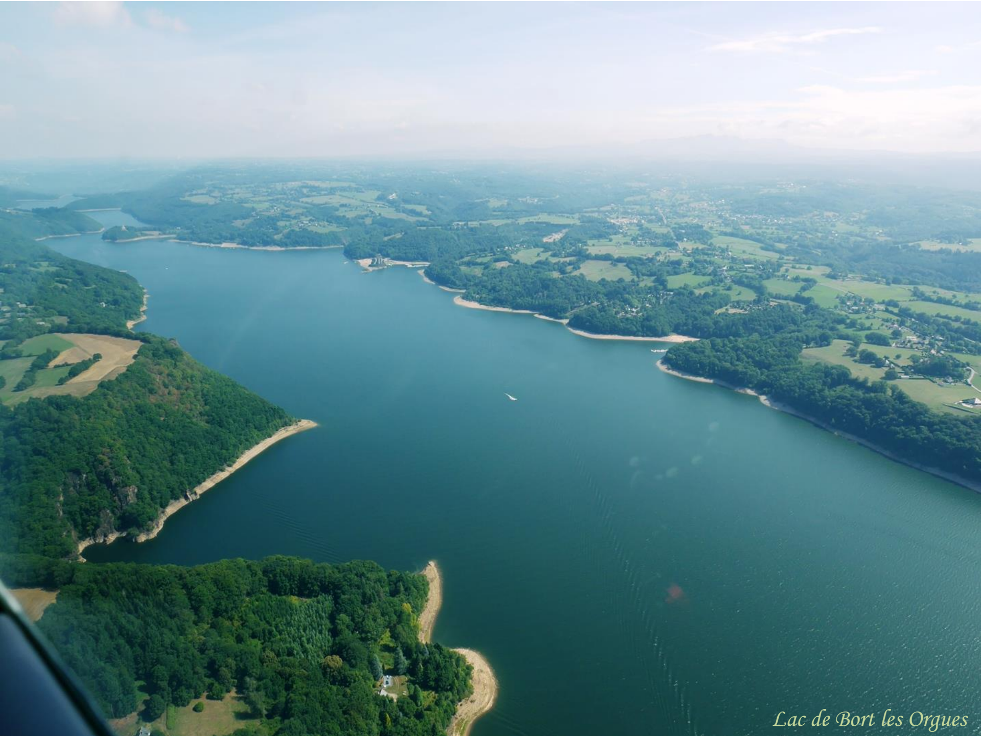
Lac de Bort les Orgues