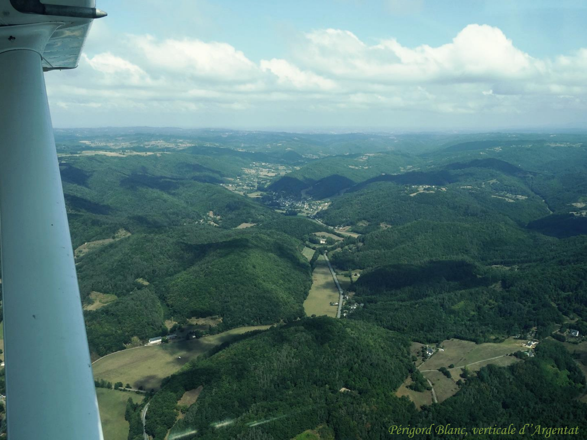
Périgord Blanc, verticale d'Argentat