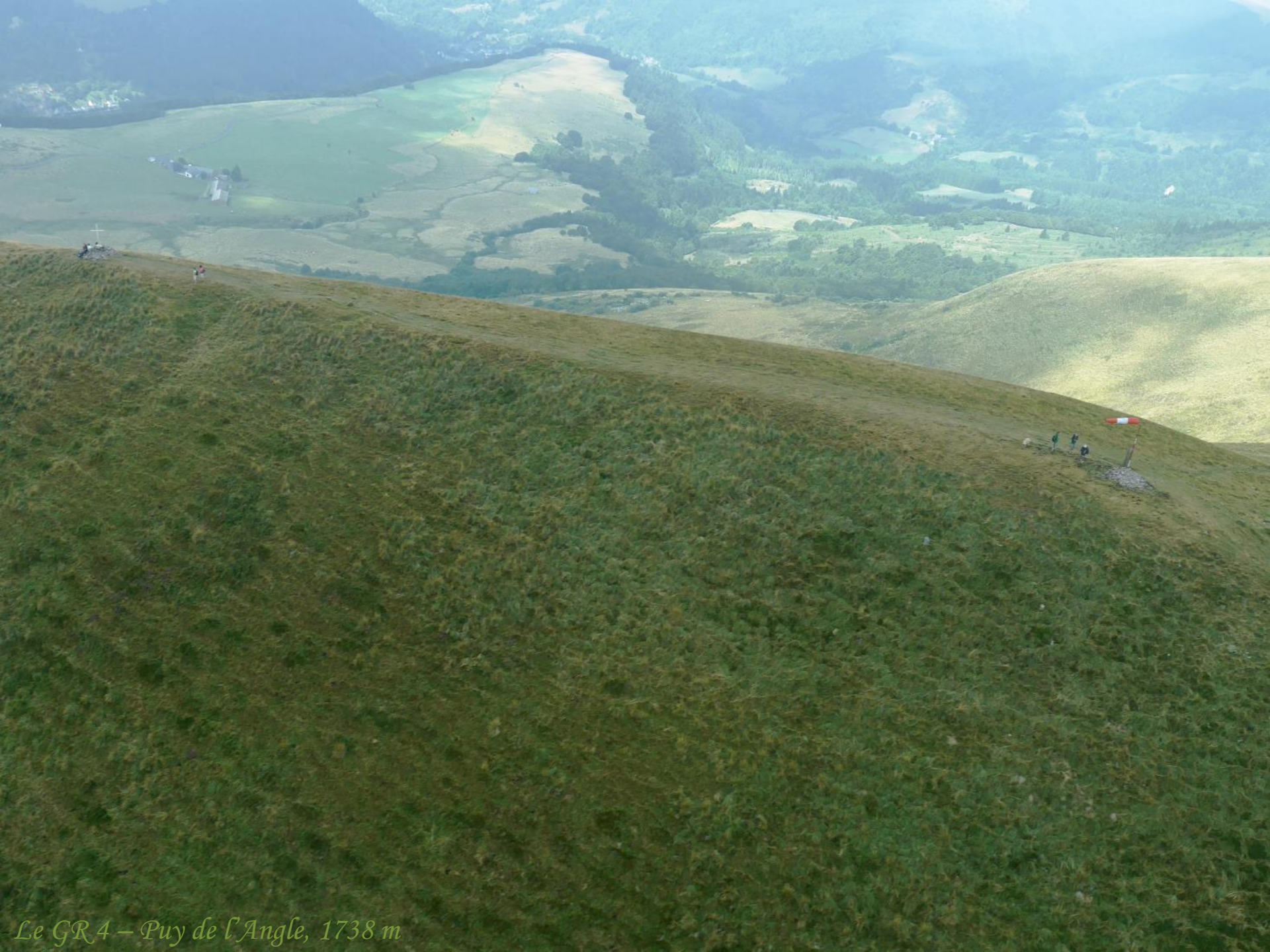
Le GR4 – Puy de l'Angle, 1738 m