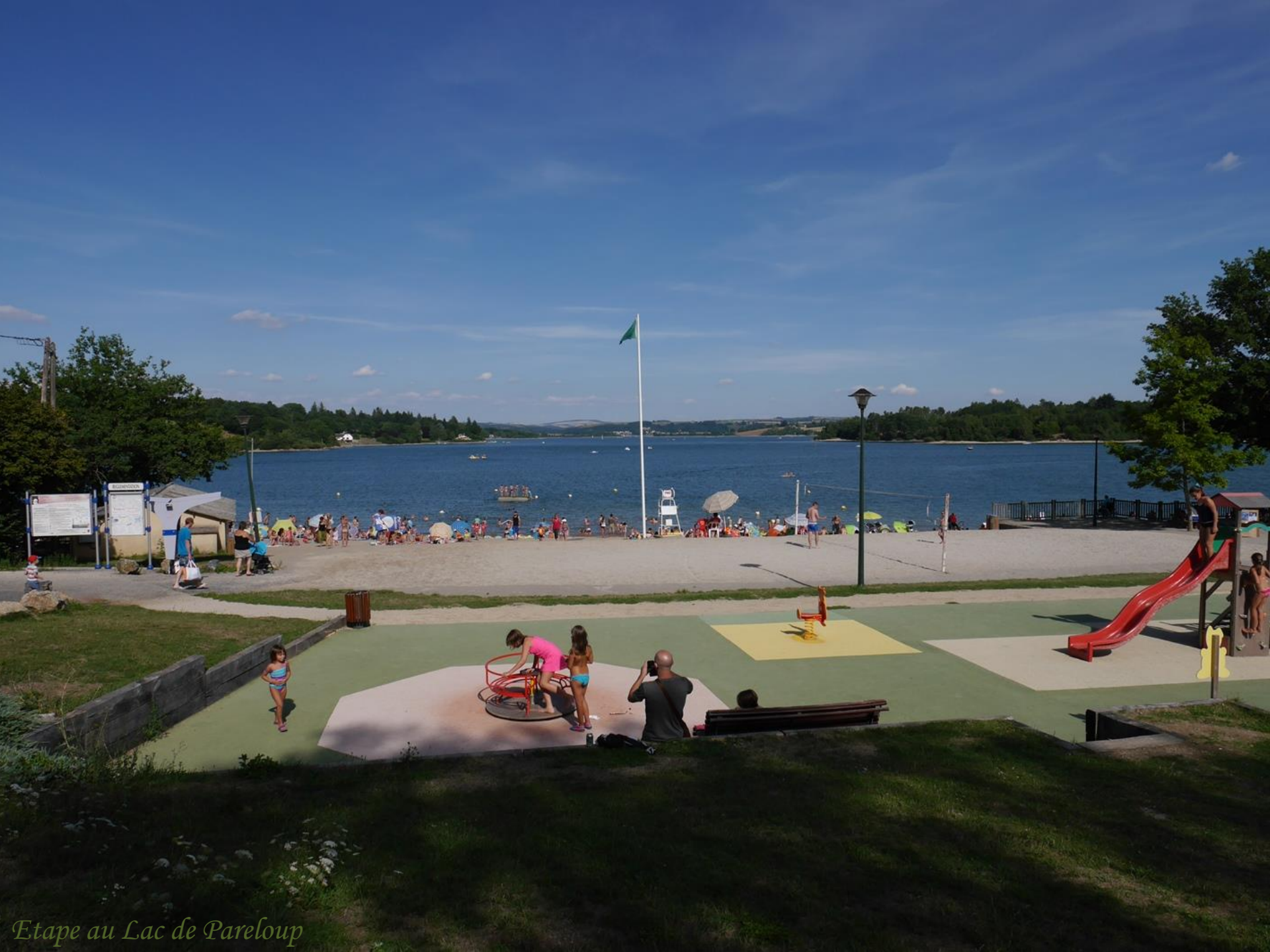
Etape au Lac de Pareloup