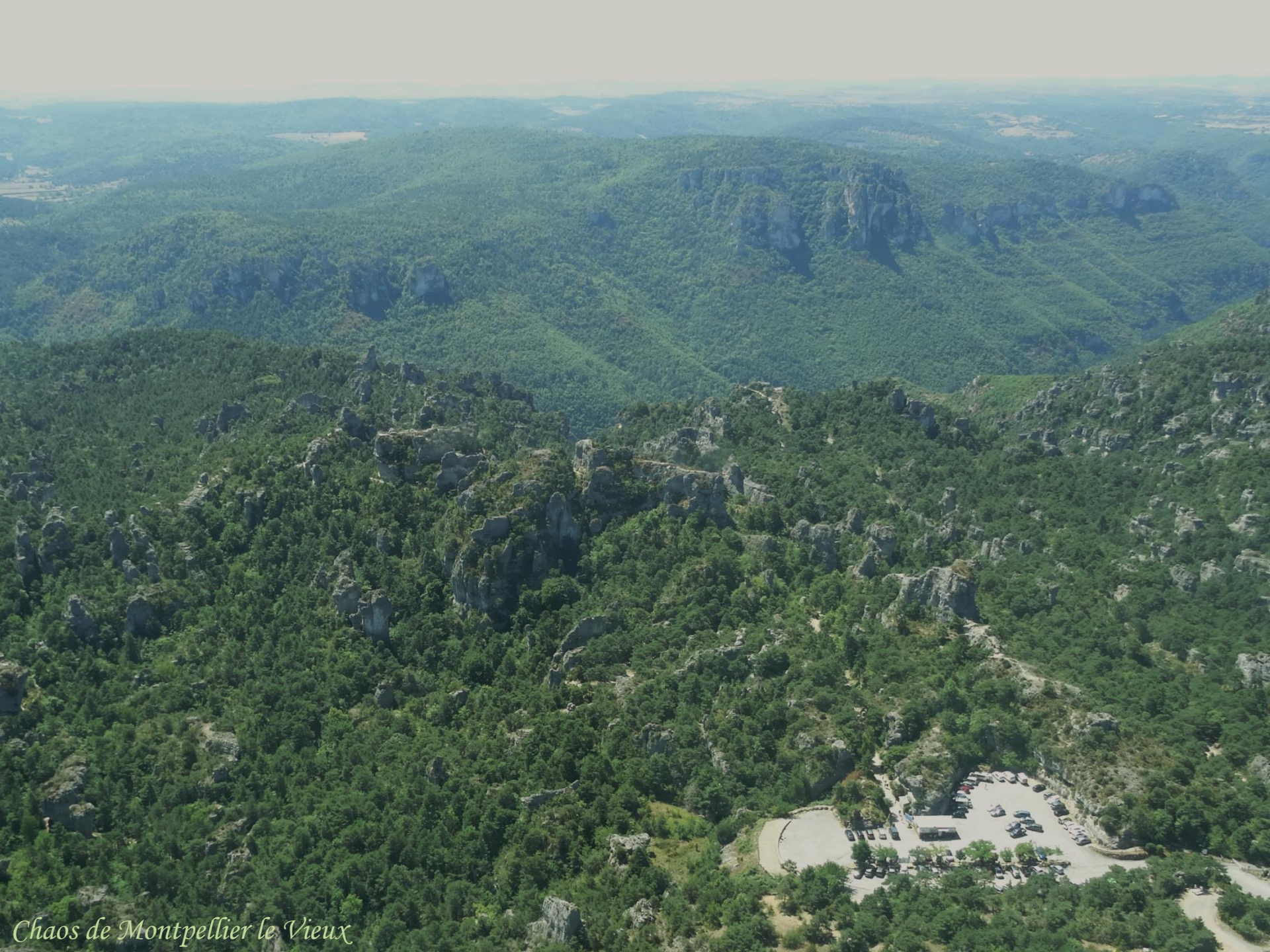
Chaos de Montpellier le Vieux