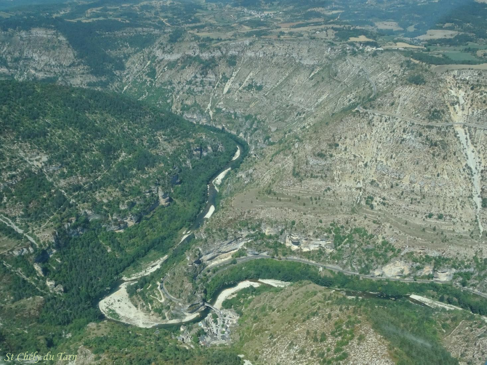
St Chély du Tarn