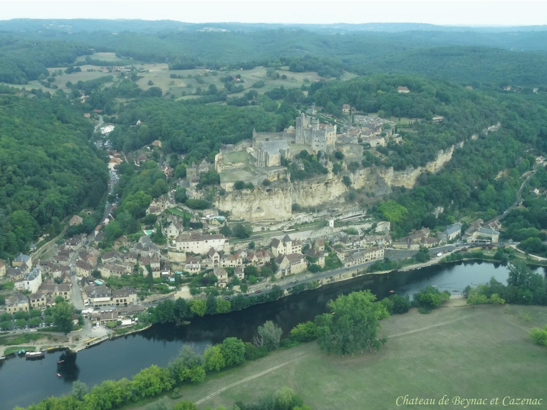
Chateau de Beynac et Cazenac