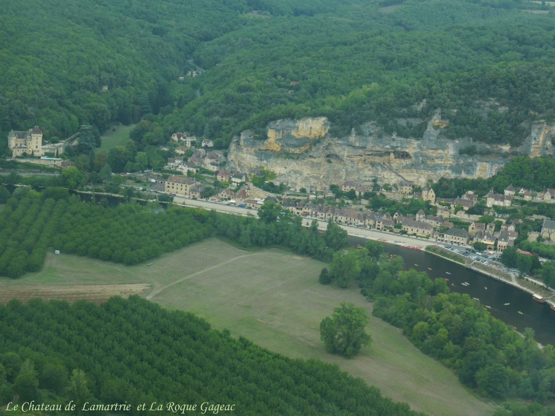
Le Chateau de Lamartrie et La Roque Gageac