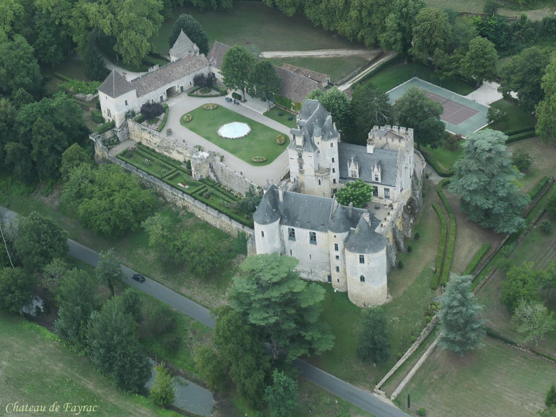
Chateau de Fayrac