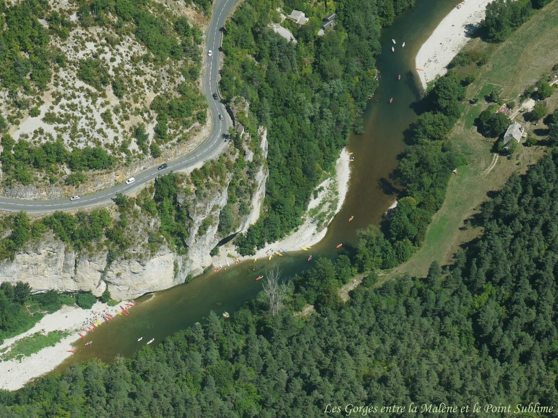
Les Gorges entre la Malène et le Point Sublime