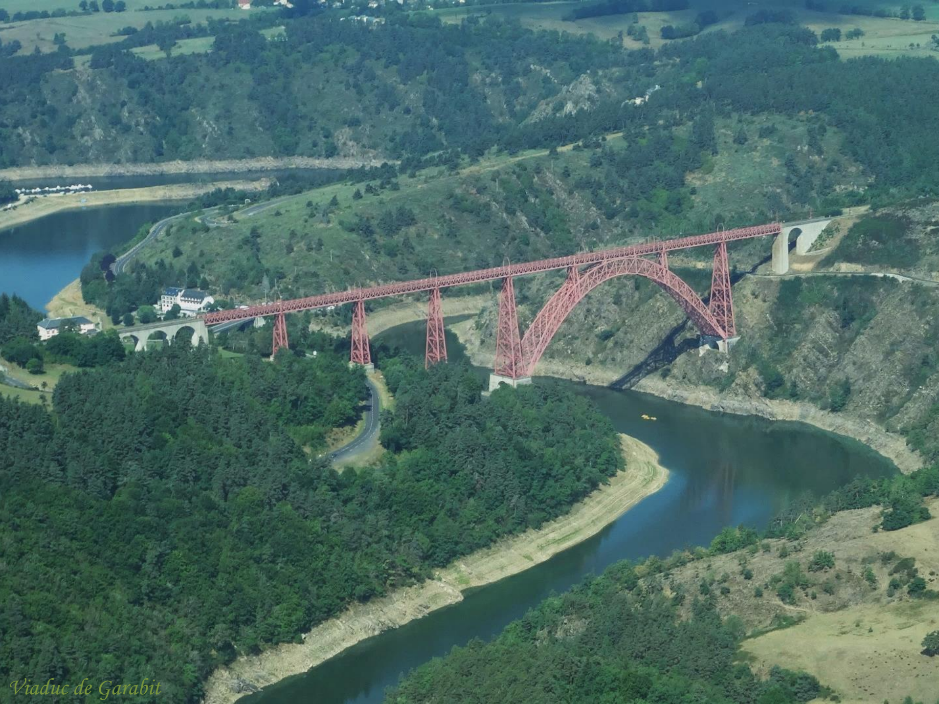
Viaduc de Garabit