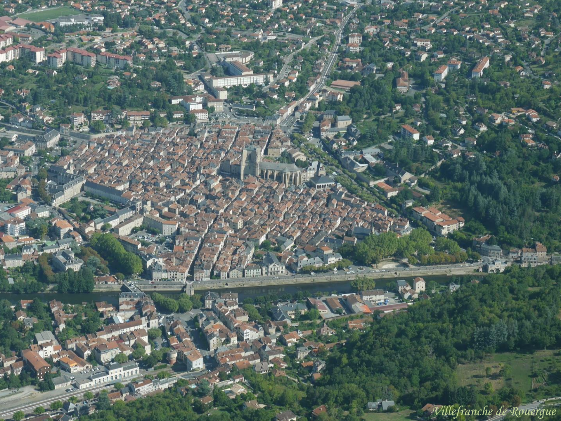
Villefranche de Rouergue