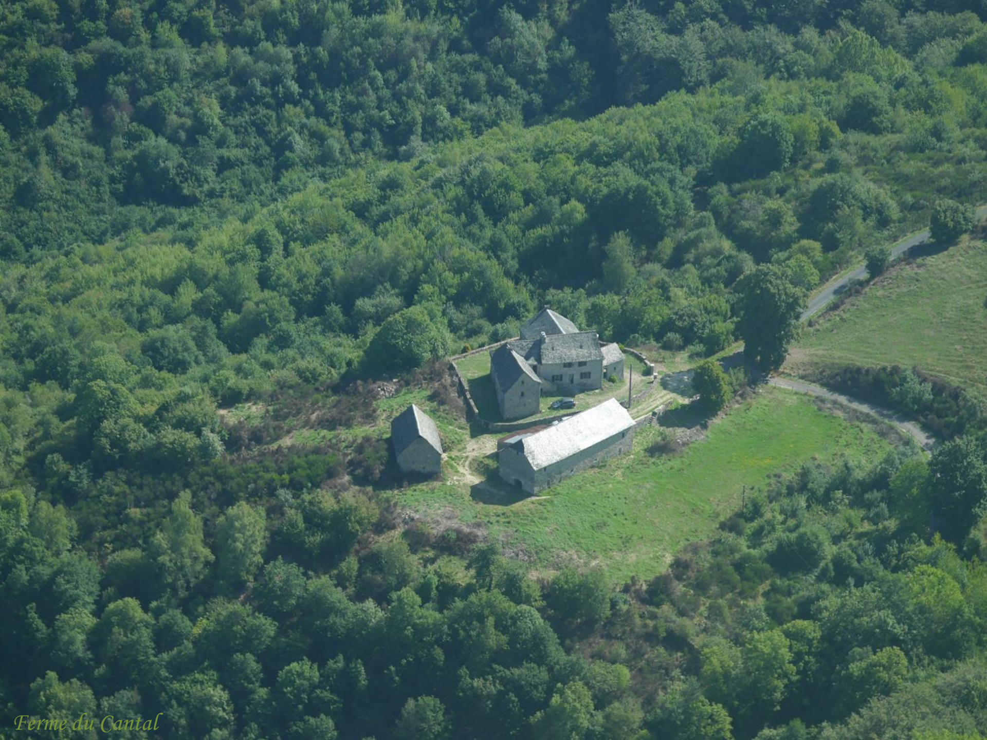
Ferme du Cantal