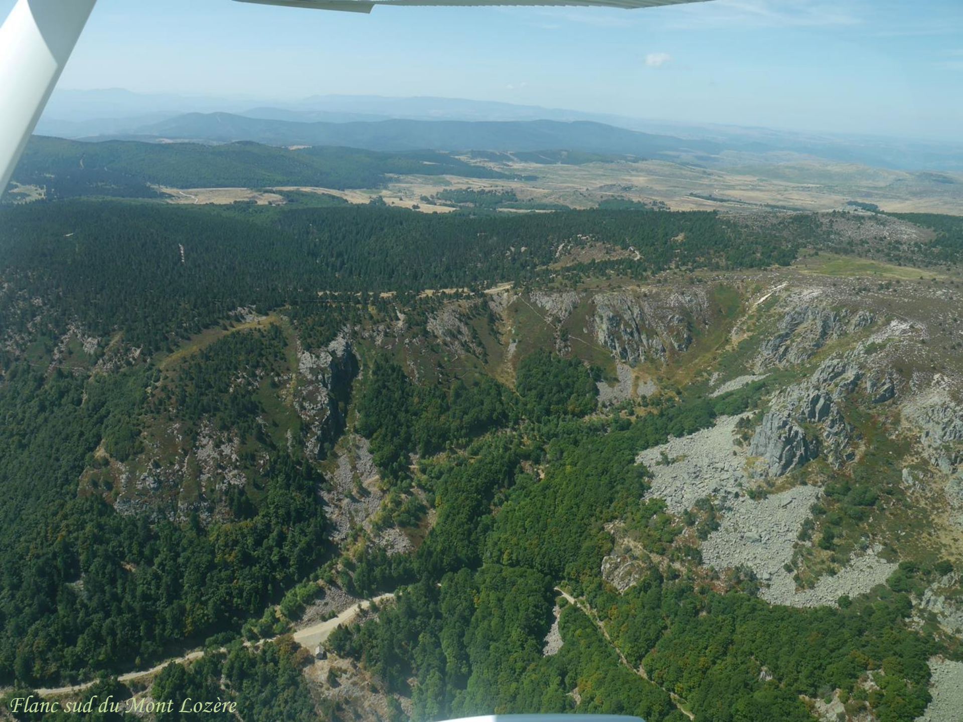
Flanc sud du Mont Lozère