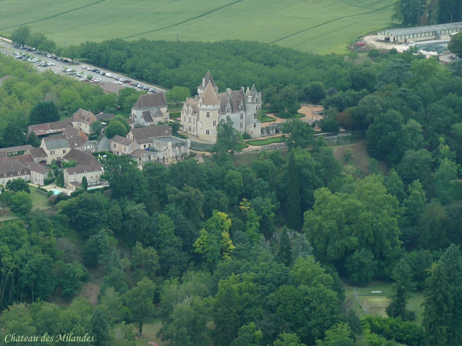
Chateau des Milandes