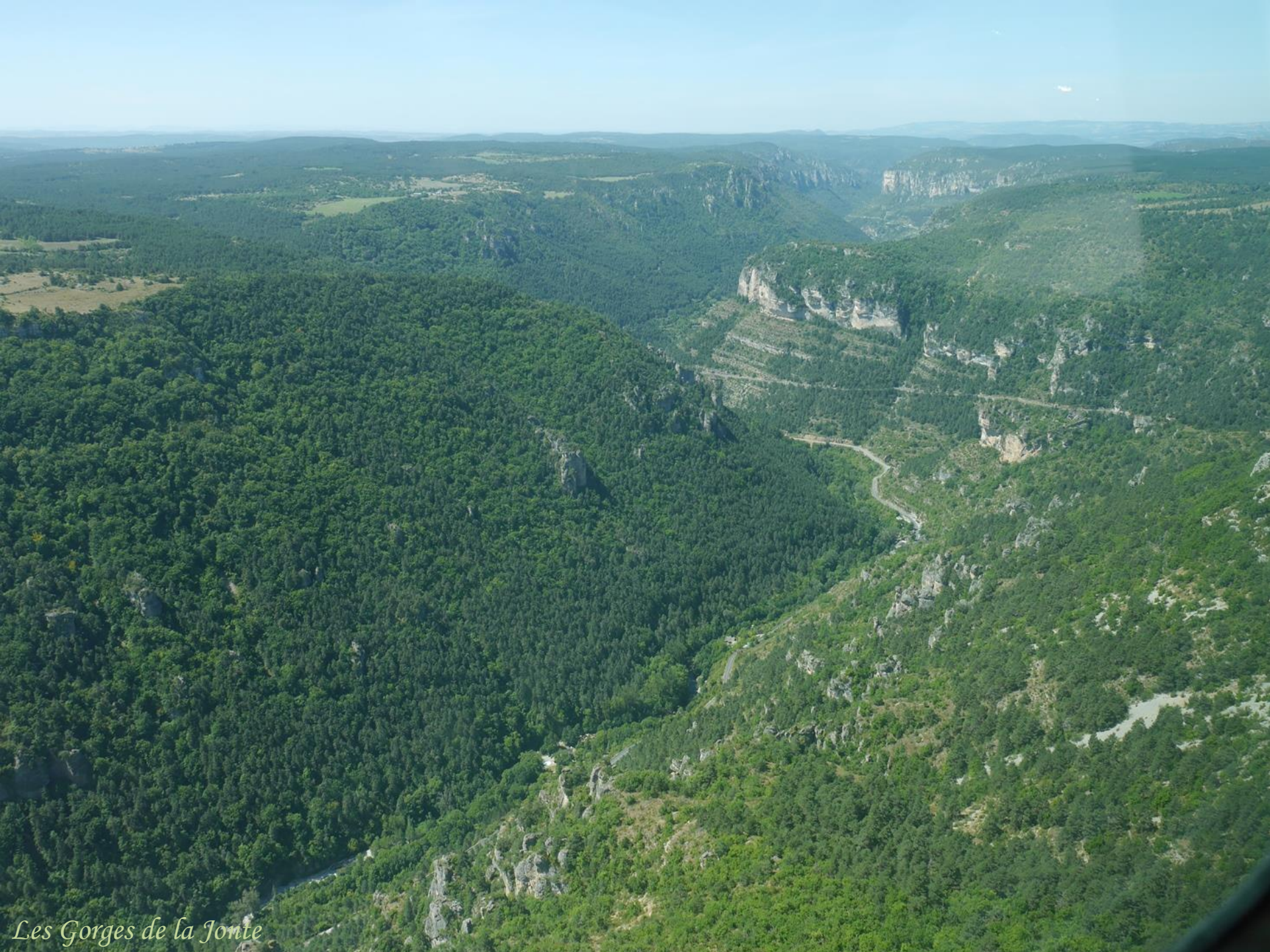
Les Gorges de la Jonte