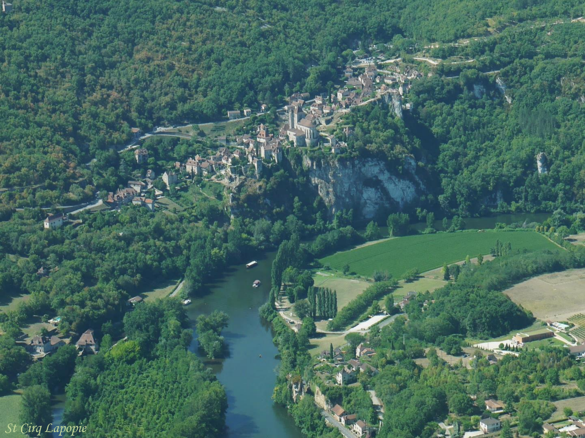
St Cirq Lapopie