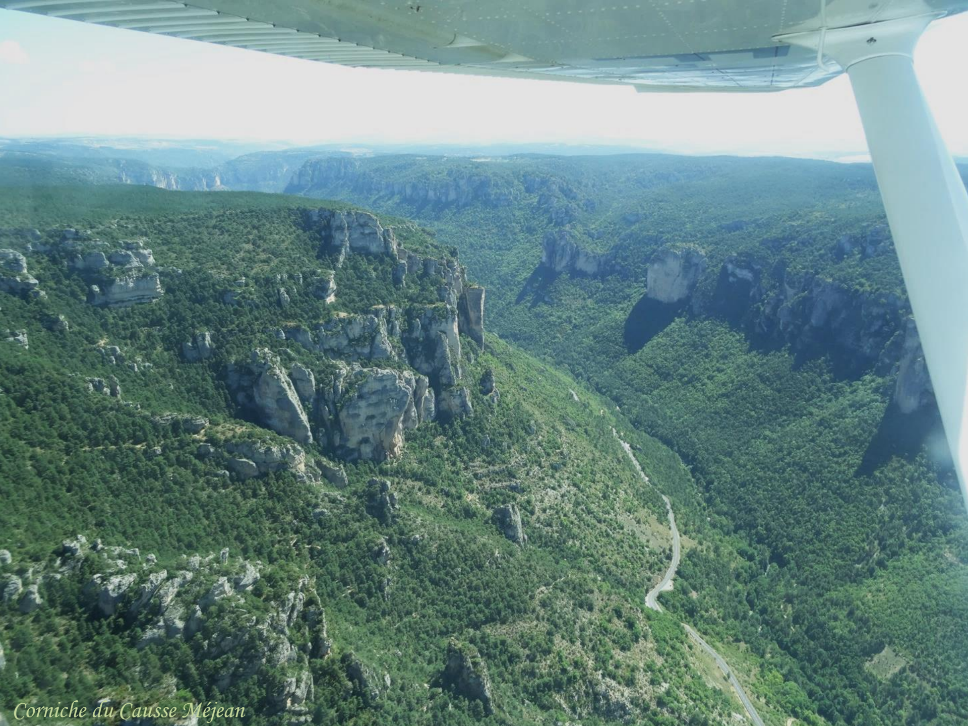
Corniche du Causse Méjean