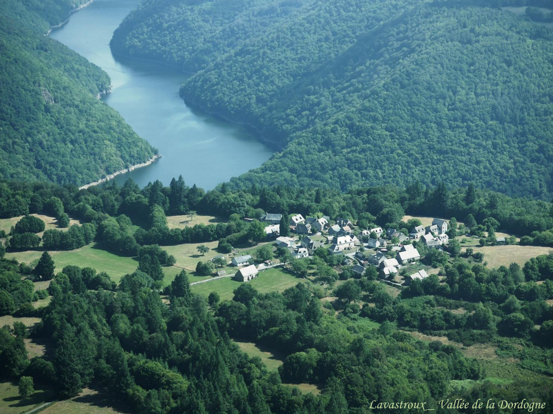
Lavastroux_ Vallée de la Dordogne