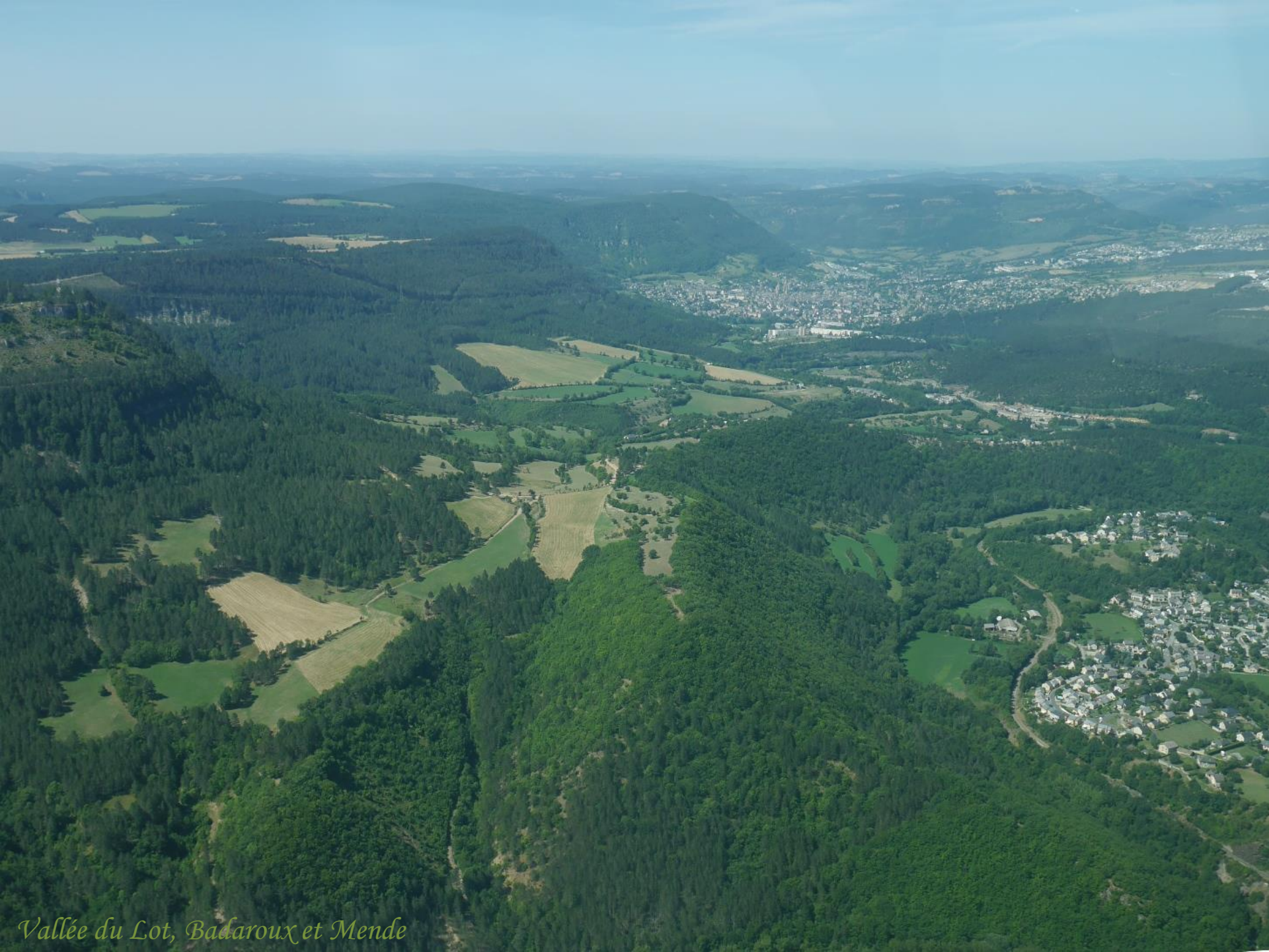
Vallée du Lot, Badaroux et Mende