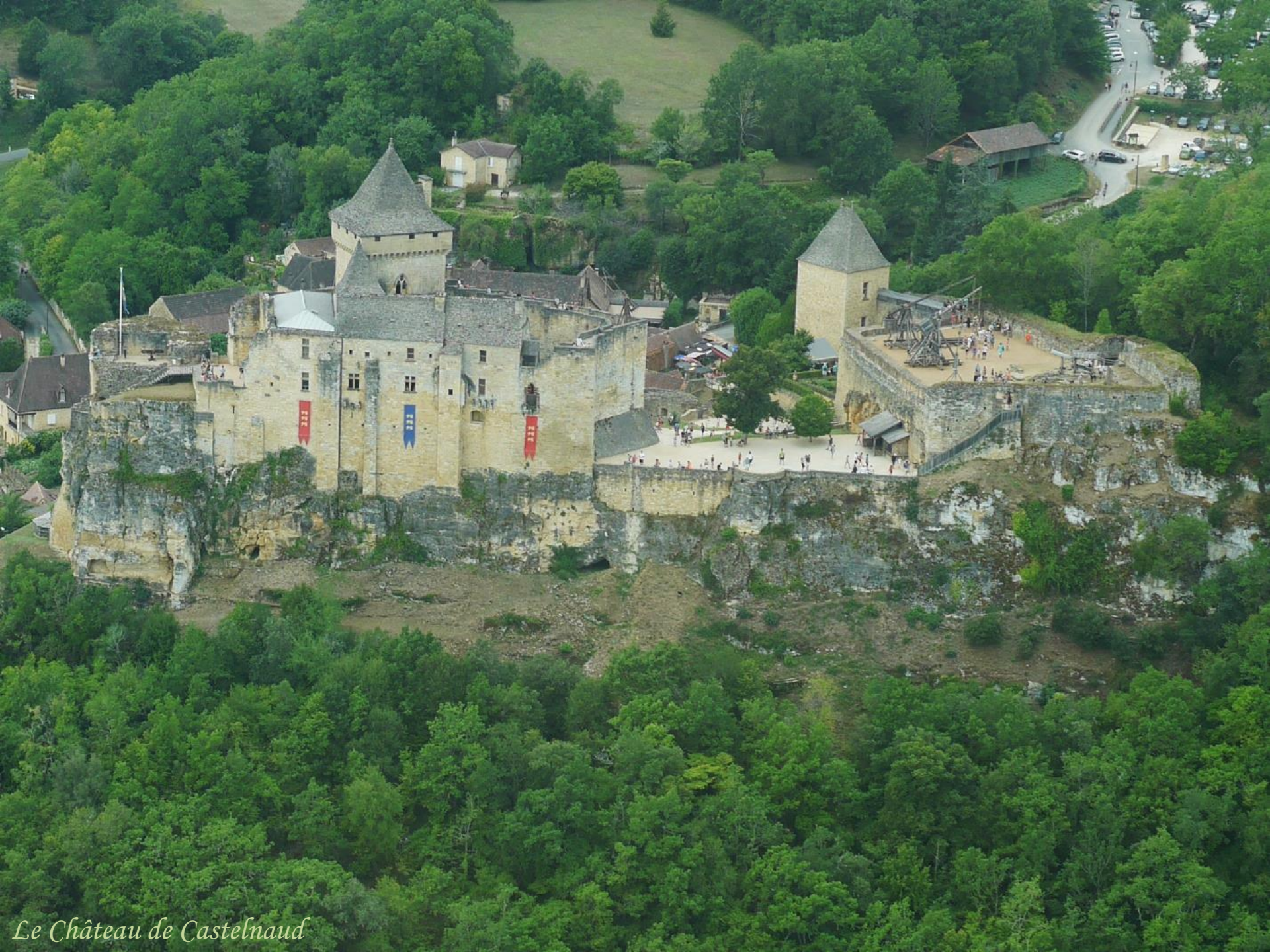
Le Château de Castelnaud