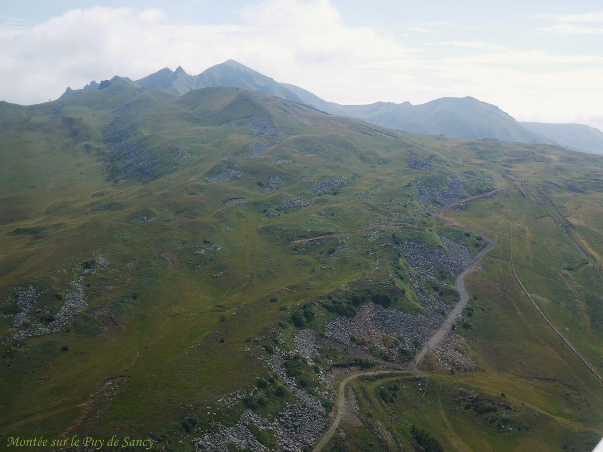
Montée sur le Puy de Sancy