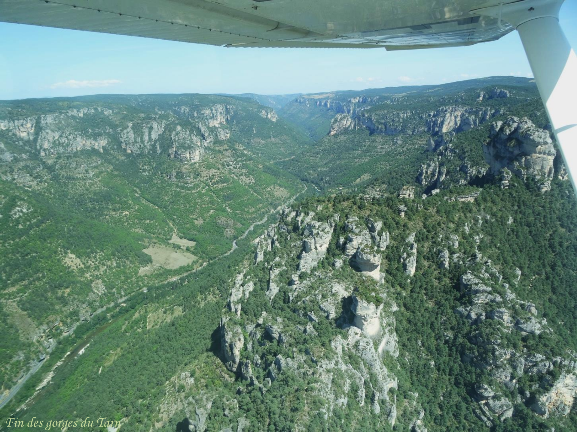
Fin des gorges du Tarn