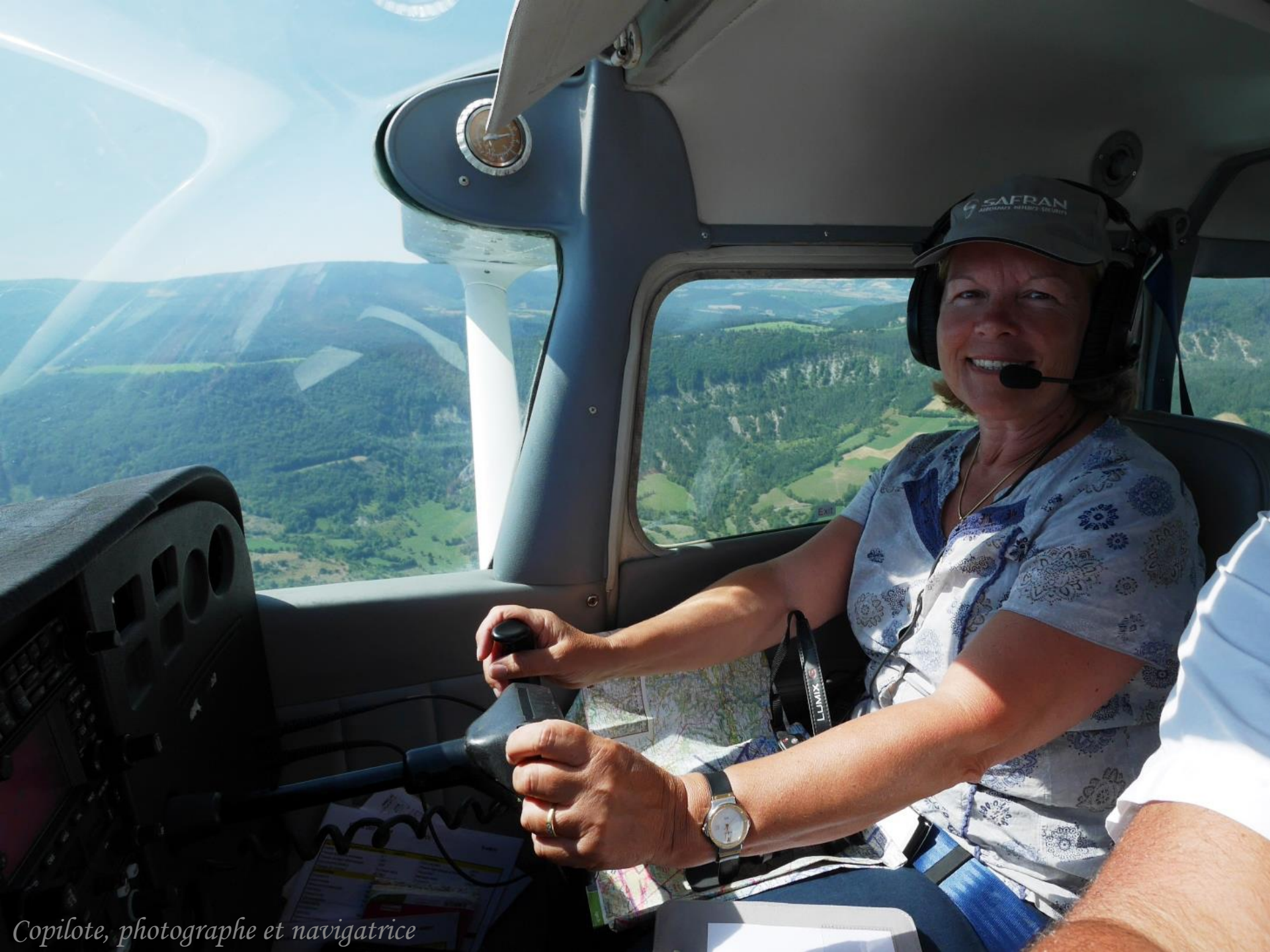
Copilote, photographe et navigatrice