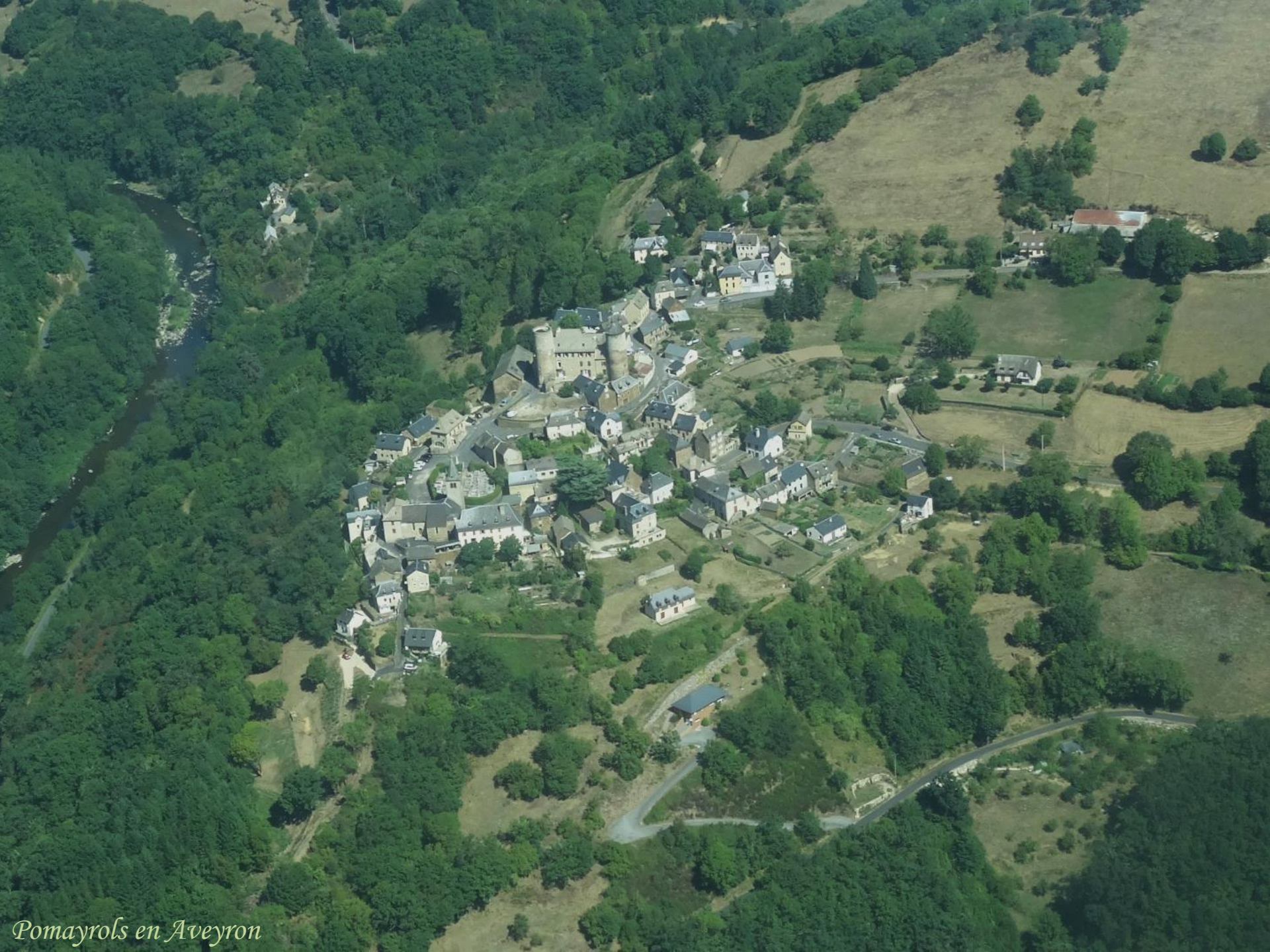
Pomayrols en Aveyron