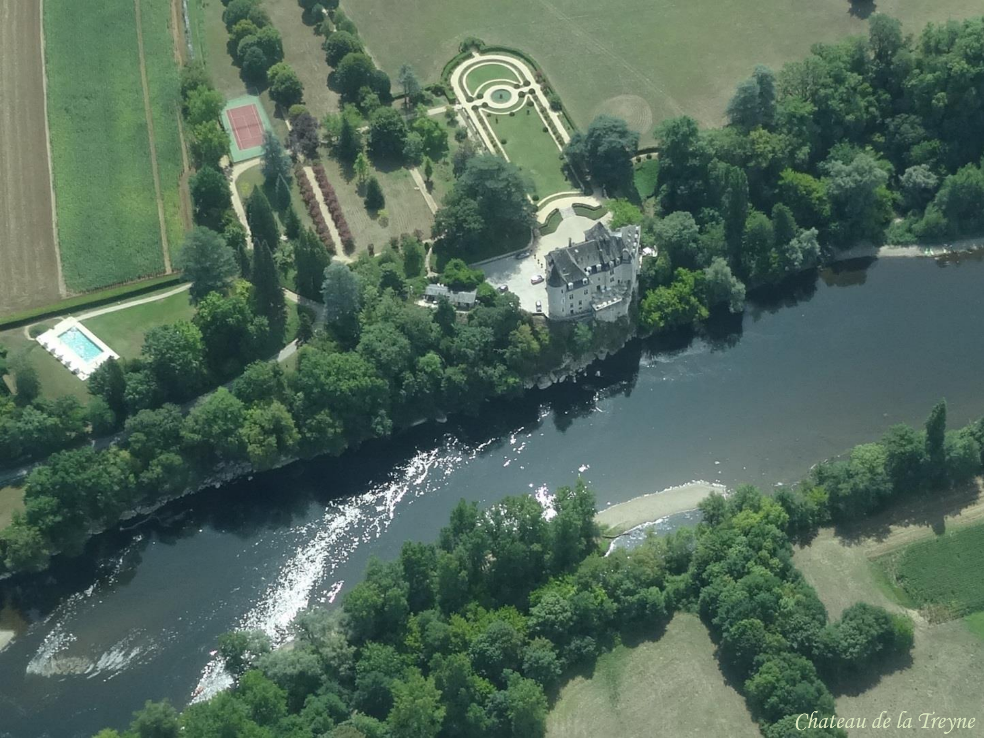
Chateau de la Treyne