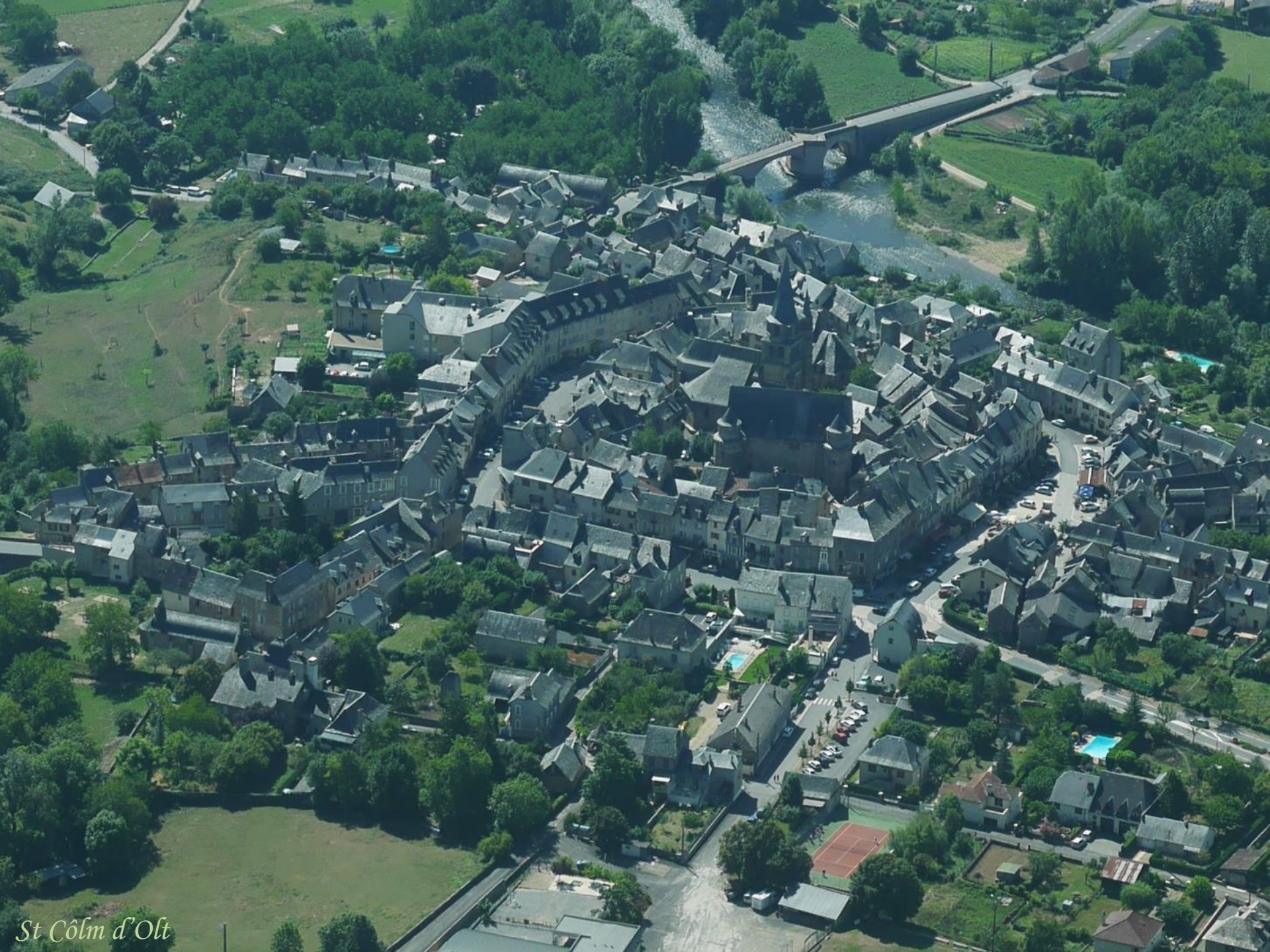
St Cólín d'Ólt