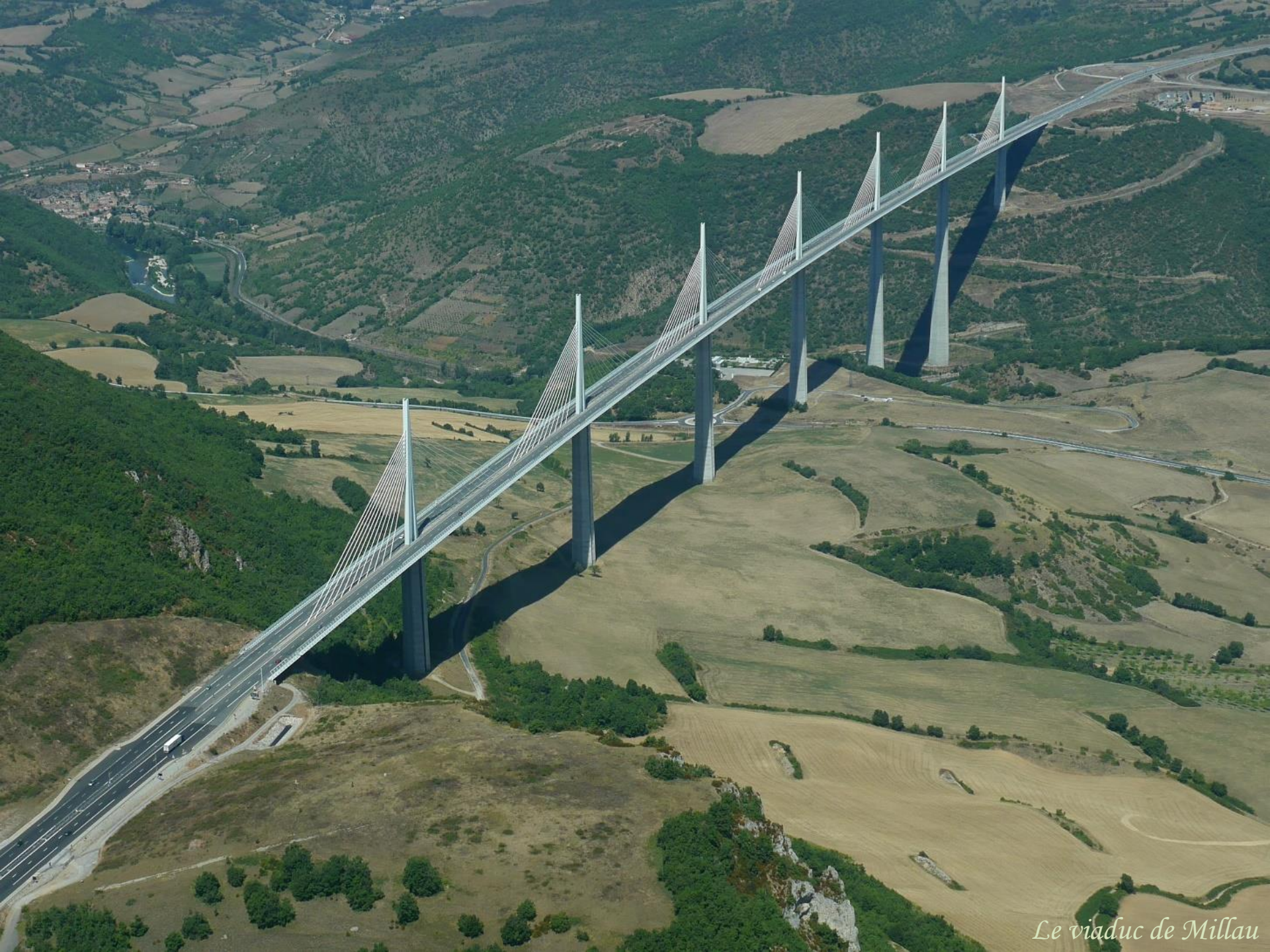
Le viaduc de Millau