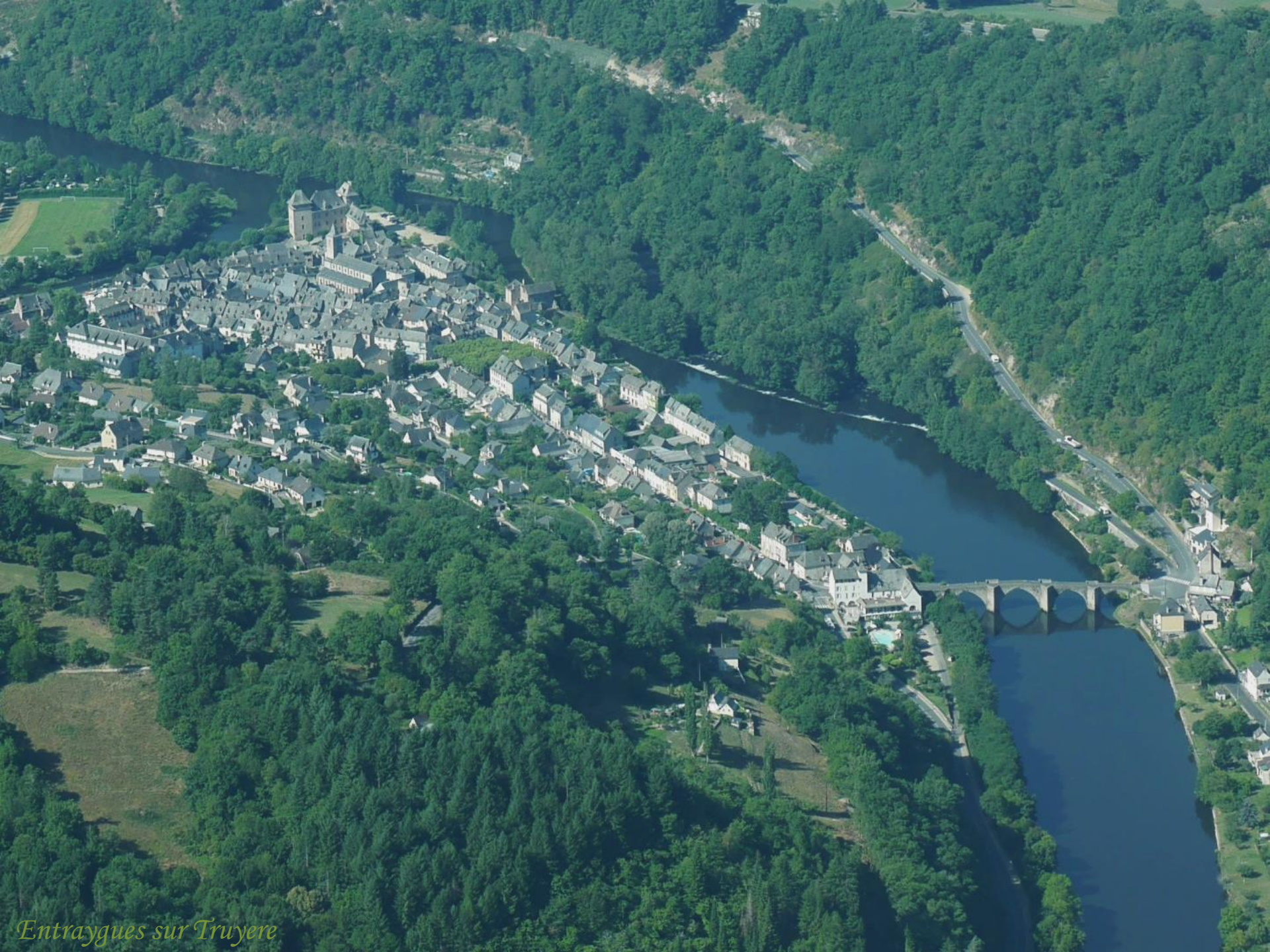
Entraygues sur Truyère