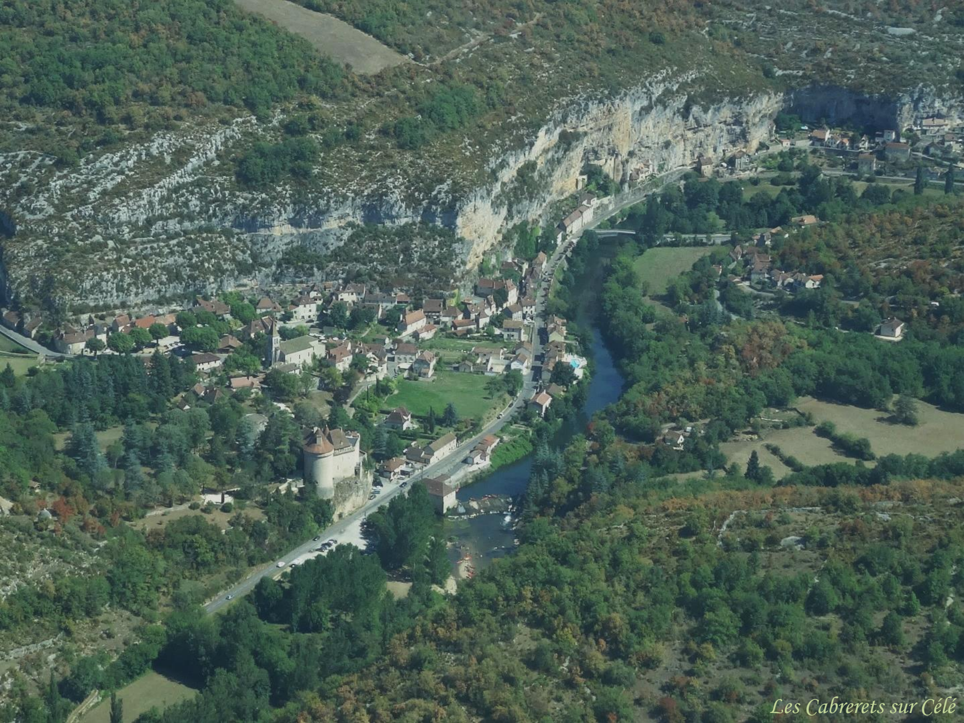
Les Cabrerets sur Célé