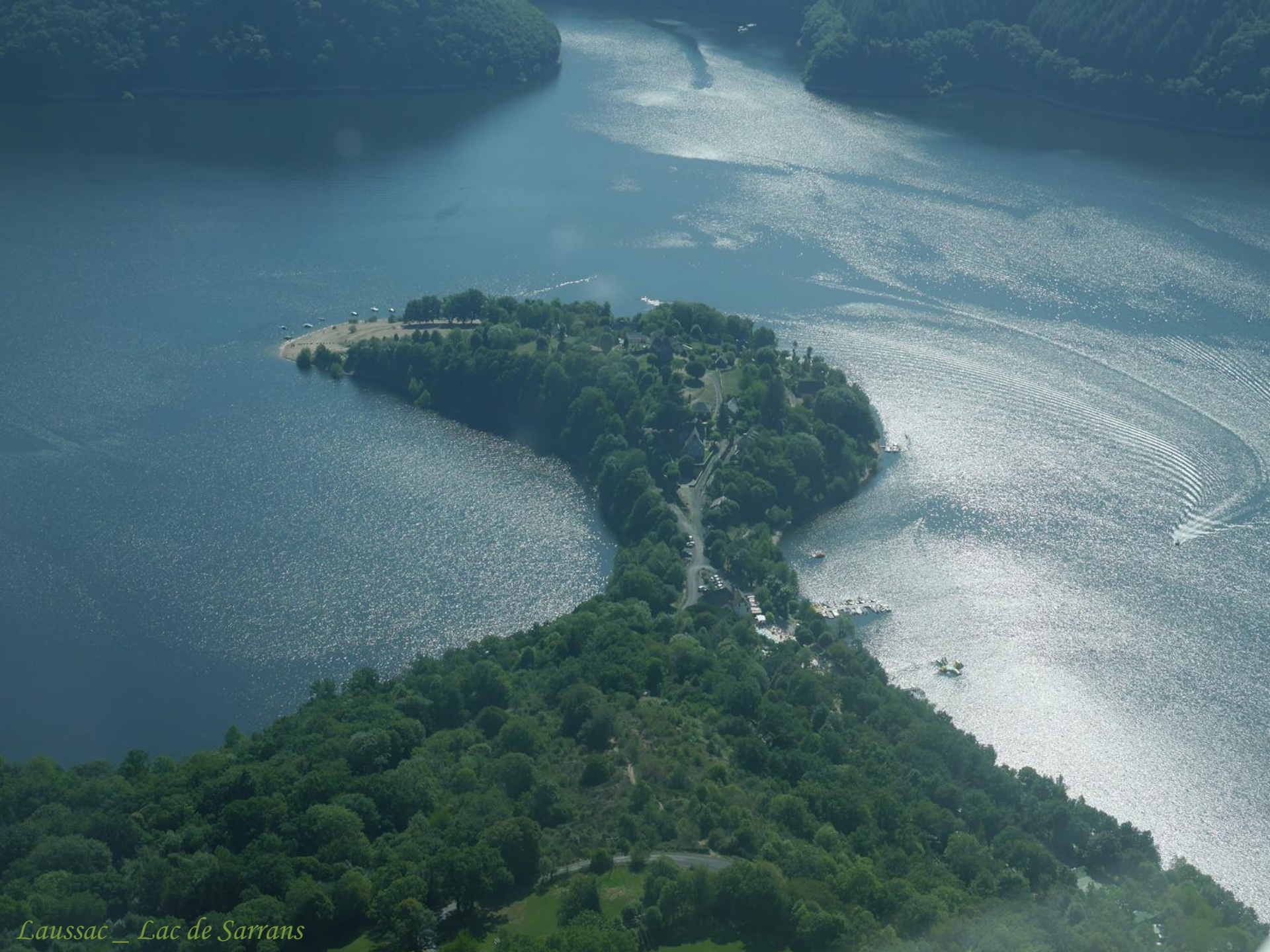
Laussac _ Lac de Sarrans