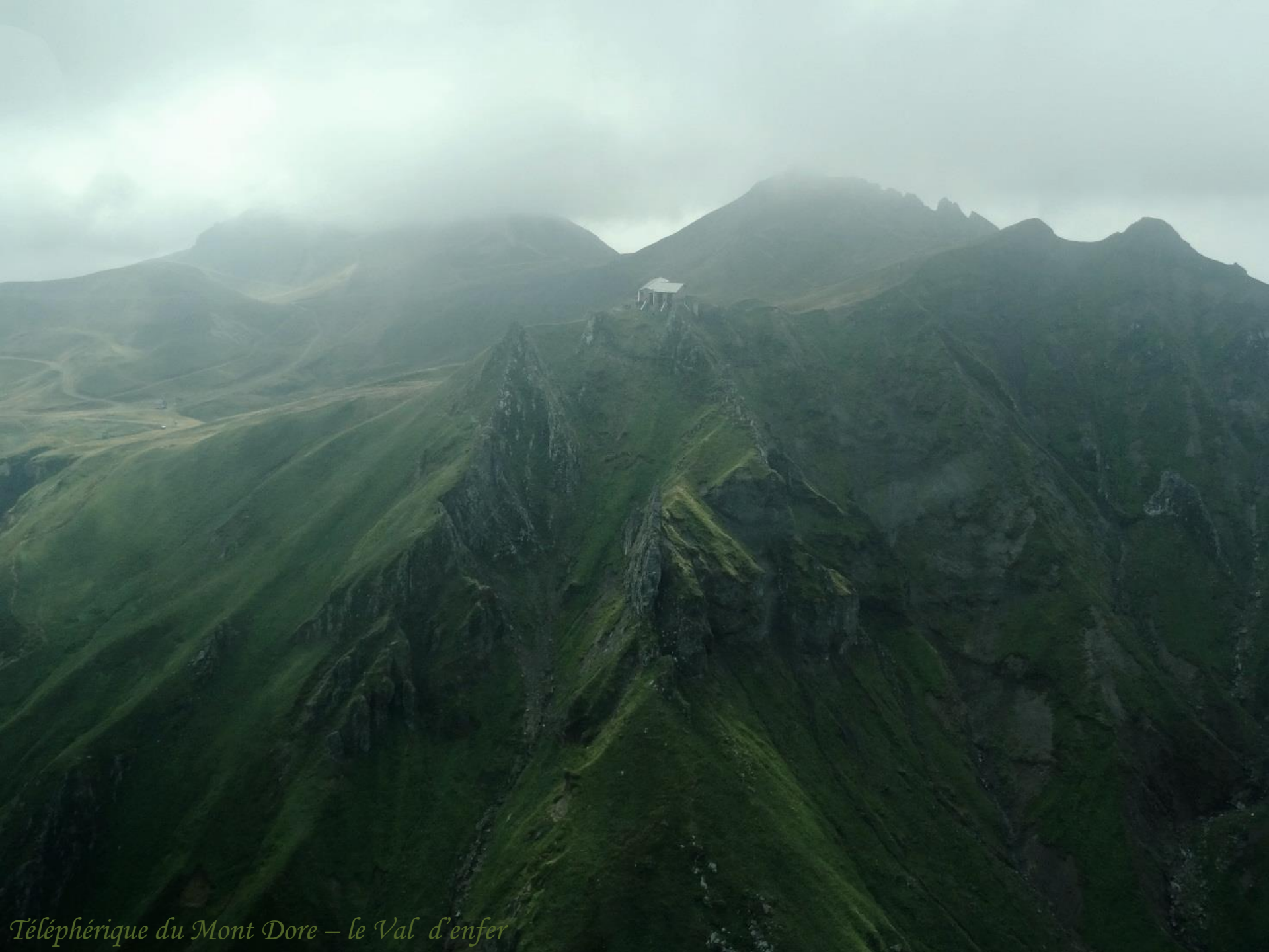
Téléphérique du Mont Dore – le Val d'enfer