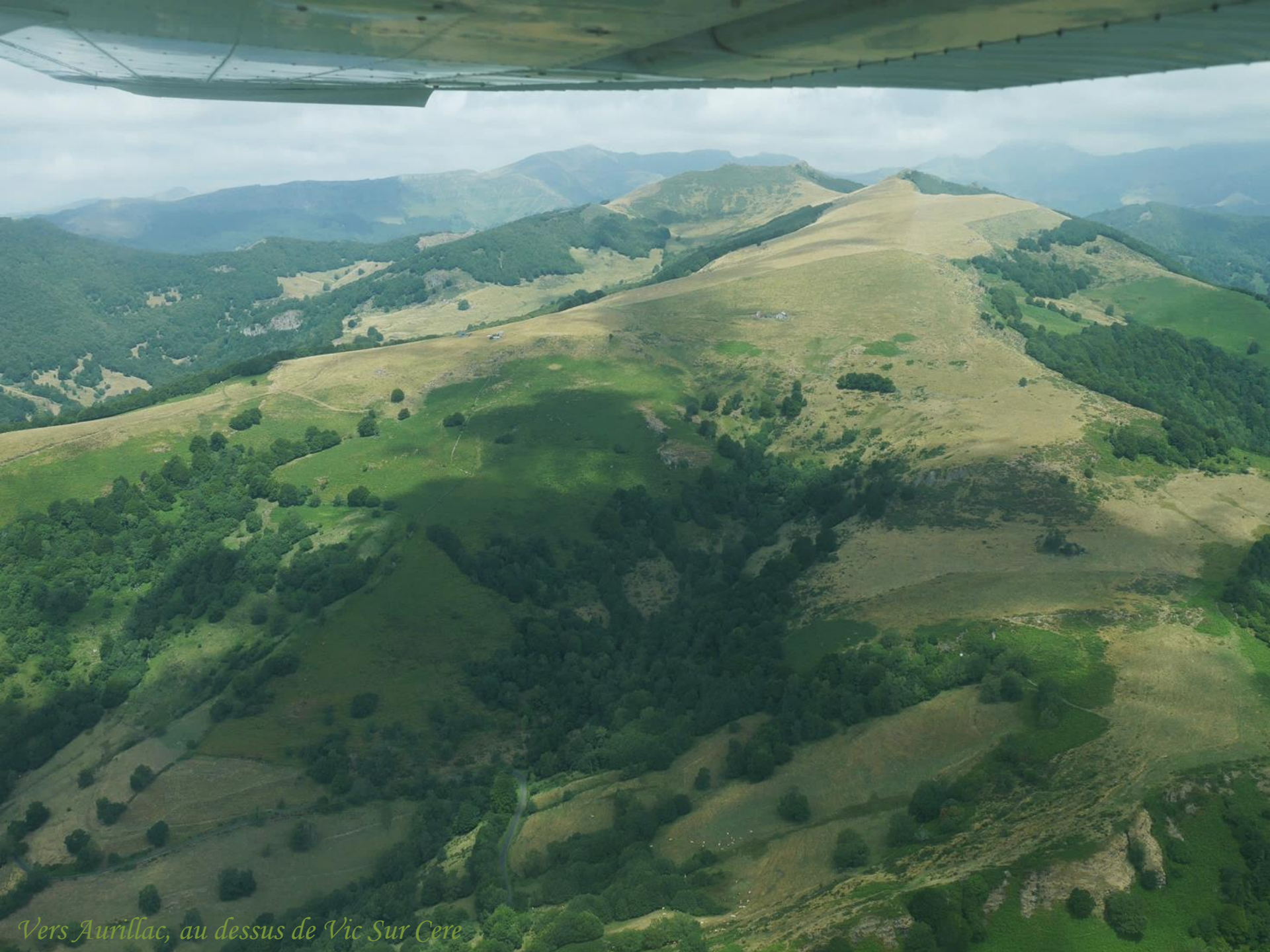
Vers Aurillac, au dessus de Vic Sur Cere