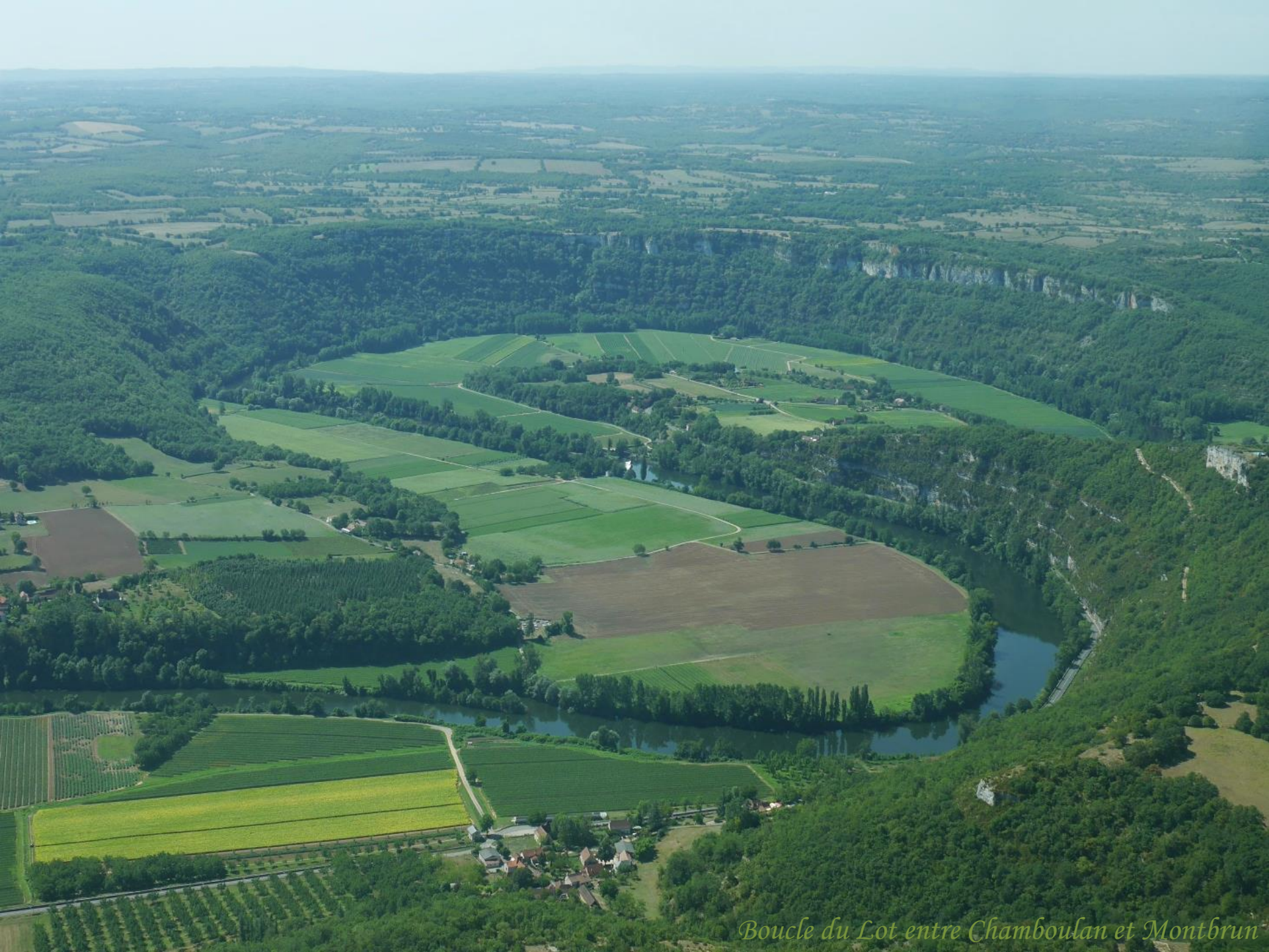
Boucle du Lot entre Chamboulan et Montbrun