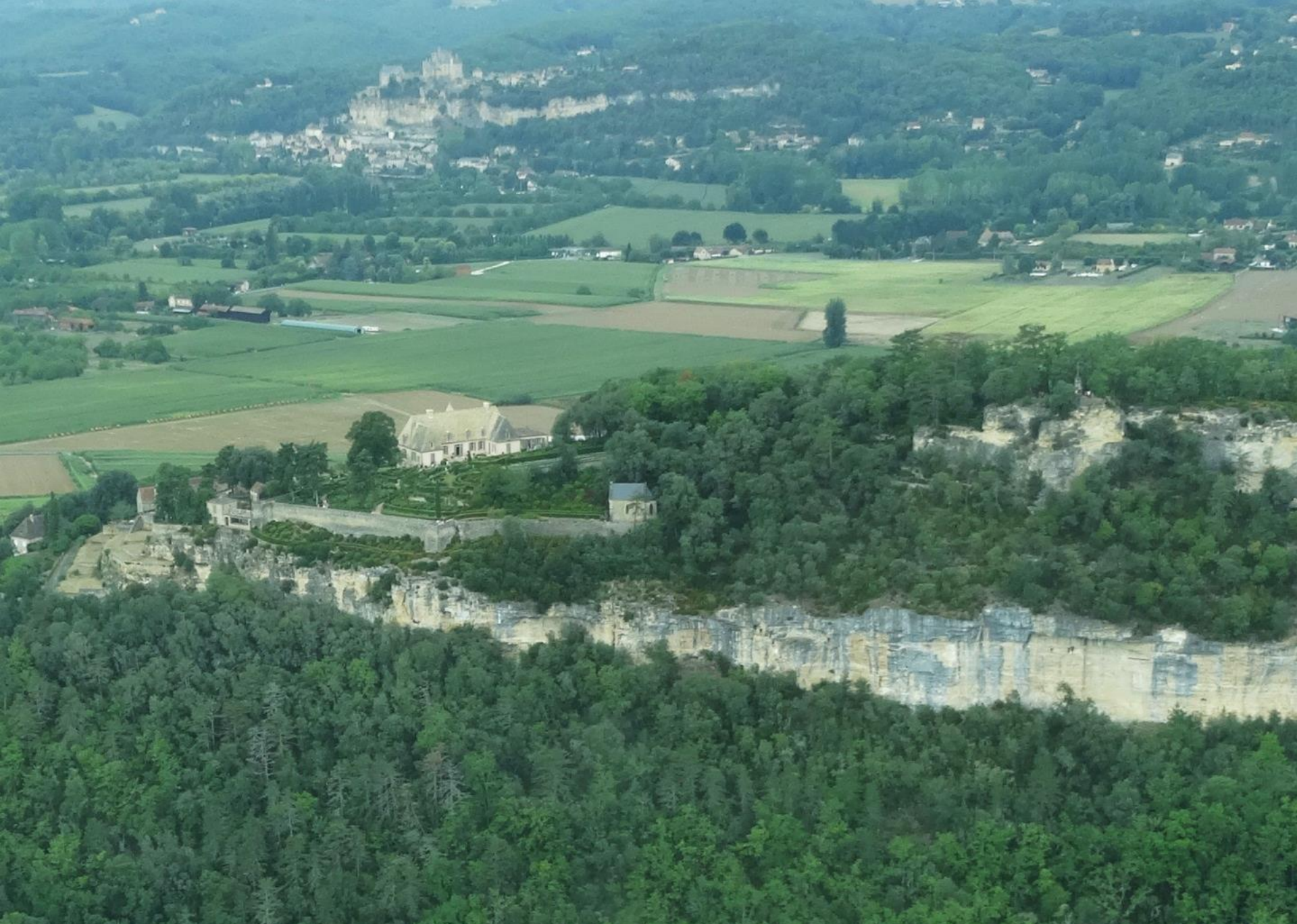
Le Château de Marqueyssac et ses jardins suspendus