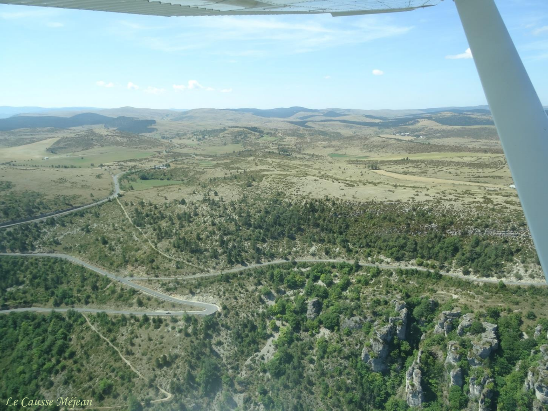
Le Causse Méjean