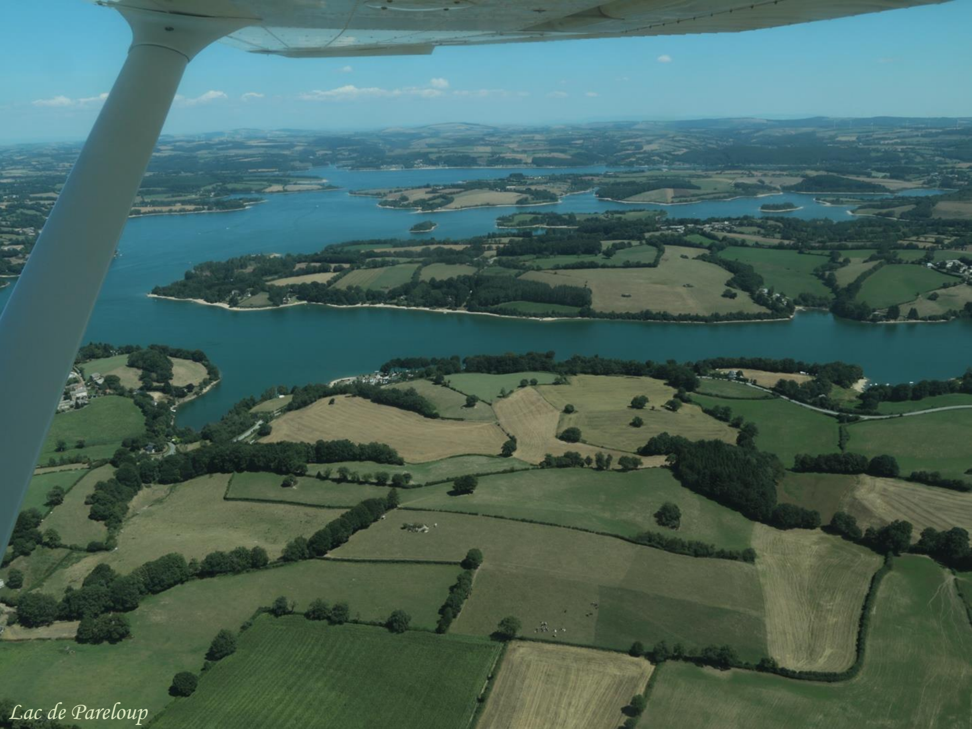
Lac de Pareloup