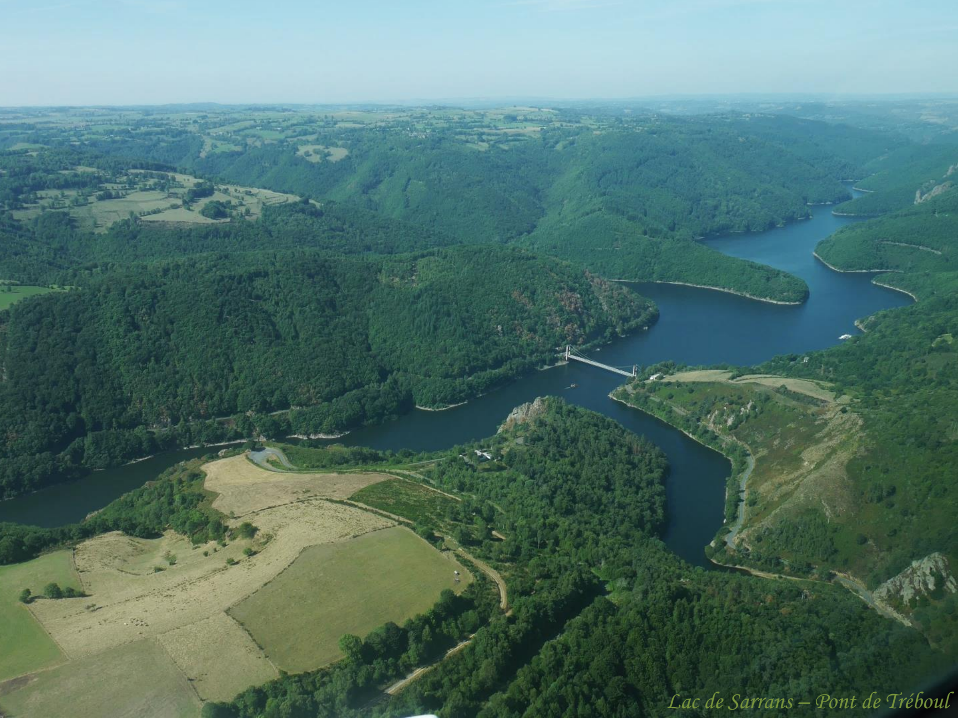
Lac de Sarrans – Pont de Tréboul