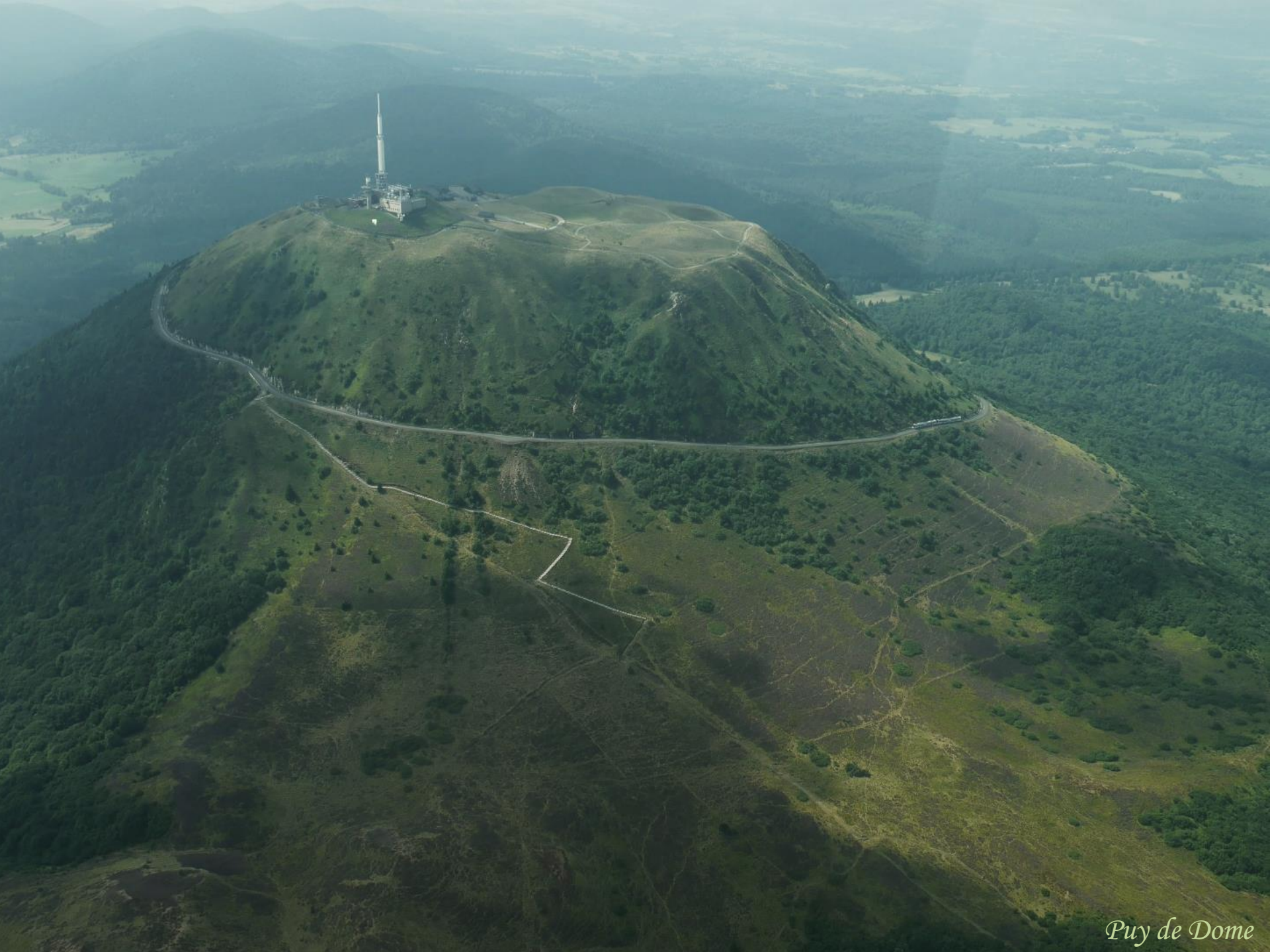
Puy de Dome