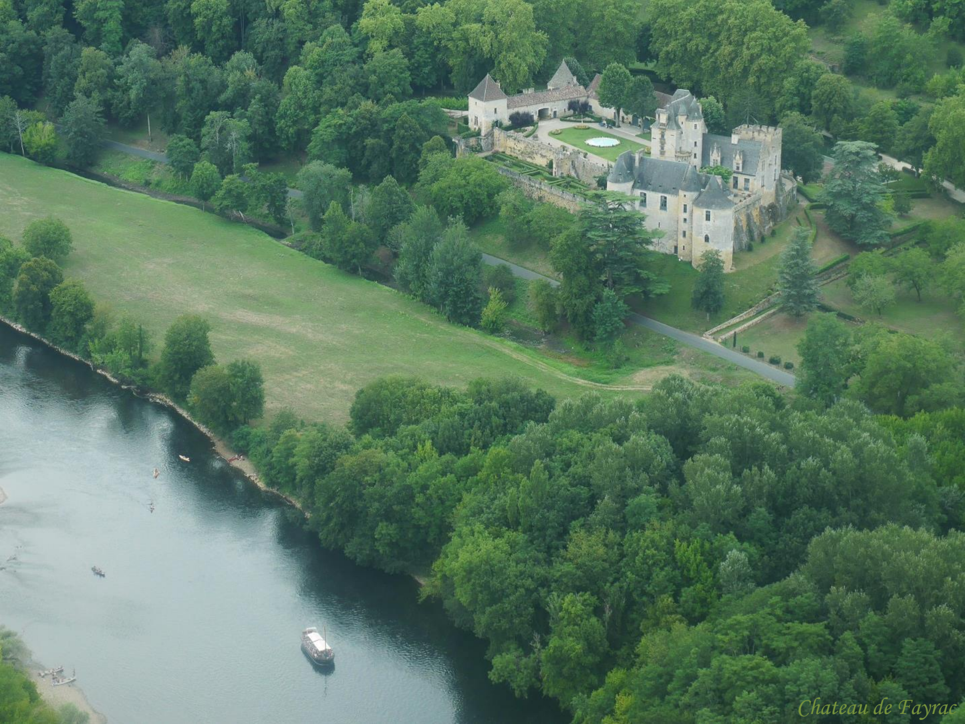
Chateau de Fayrac