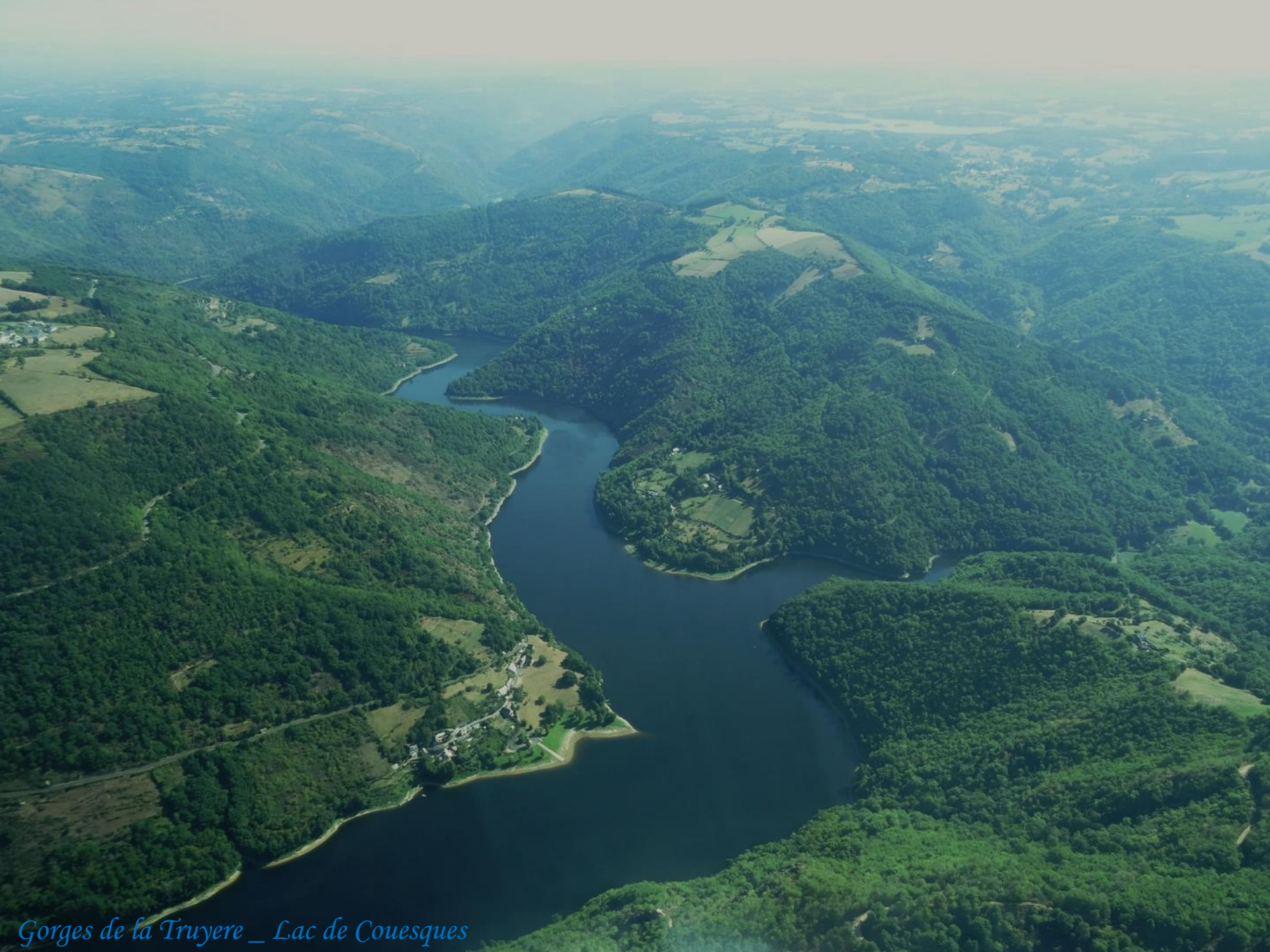
Gorges de la Truyere _ Lac de Couesques