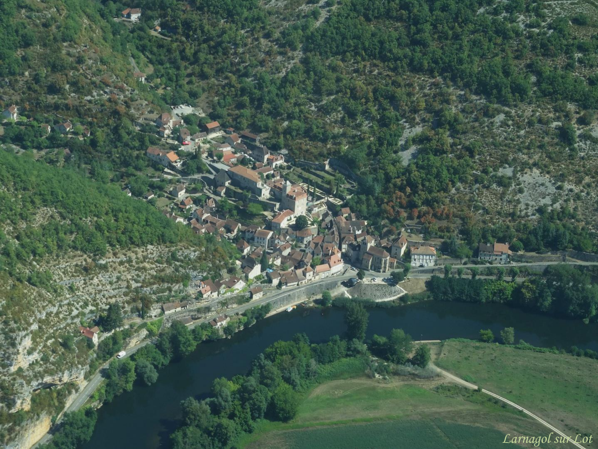
Larnagol sur Lot