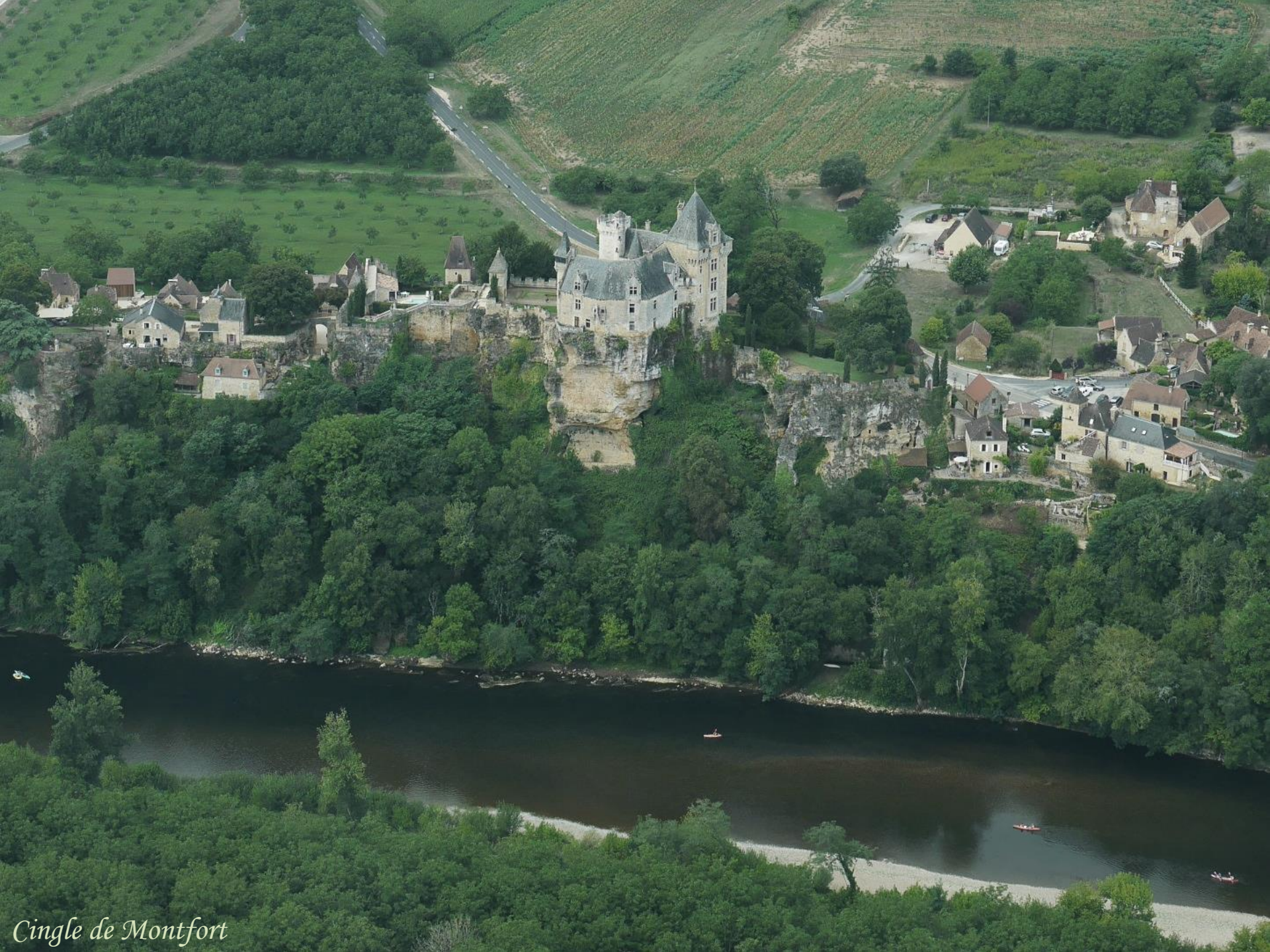
Cingle de Montfort