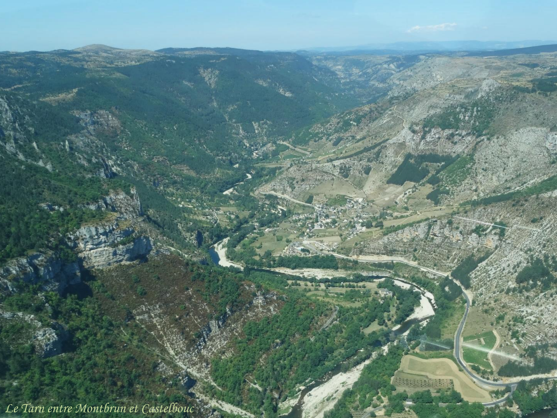
Le Tarn entre Montbrun et Castelbouc